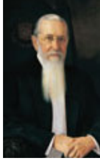
Joseph F. Smith