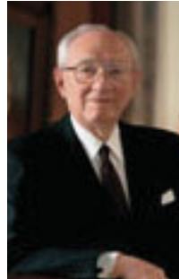
Gordon B. Hinckley