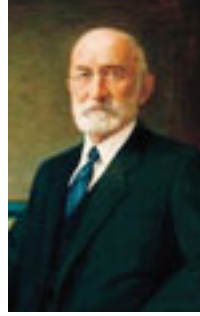
Heber J. Grant