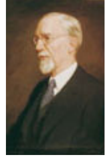
George Albert Smith