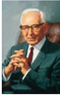
Joseph Fielding Smith