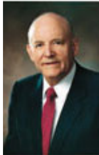
Howard W. Hunter