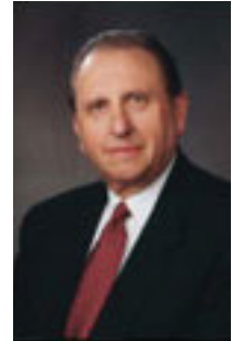
Thomas S. Monson