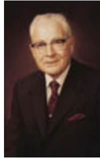
Harold B. Lee