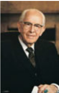
Ezra Taft Benson