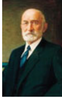
Heber J. Grant