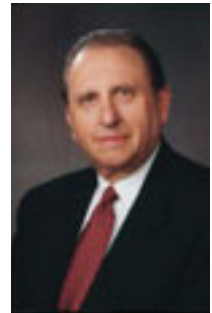
Thomas S. Monson