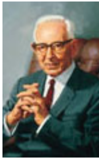
Joseph Fielding Smith