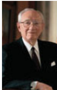
Gordon B. Hinckley