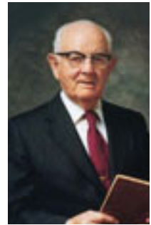
Spencer W. Kimball