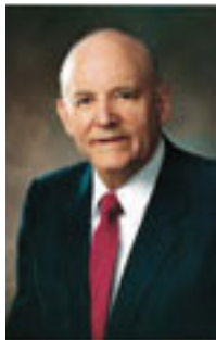
Howard W. Hunter