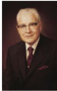
Harold B. Lee