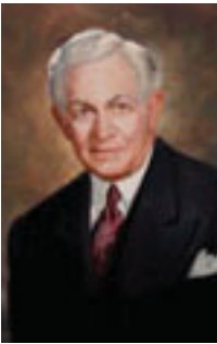
David O. McKay