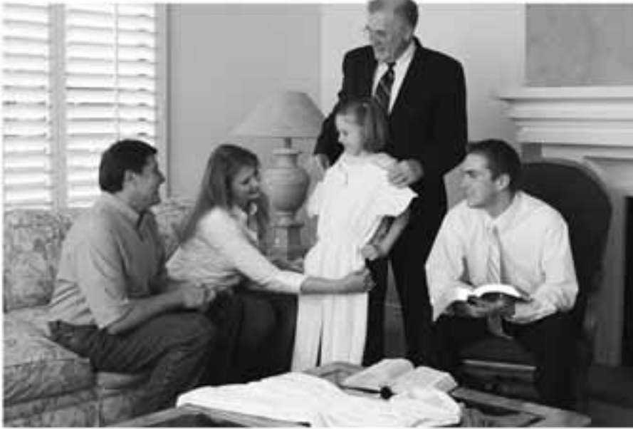
Οι ηγέτες στηρίζουν τους γονείς τιμώντας τους κι όχι παίρνοντας τη θέση τους στη ζωή ενός παιδιού.

φουμε στον κόσμο να απεμπολήσουμε αυτό που γνωρίζουμε ότι μας έχει δοθεί βάσει του θείκου σχεδίου.