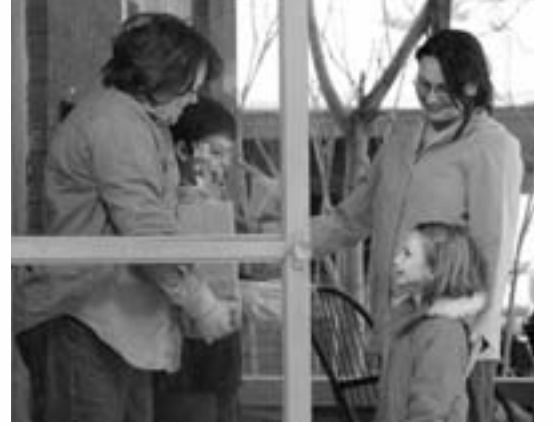
நமது குடும்பங்களிலும் நமது சபை அழைப்புகளிலும் நாம் செய்யும் பணிகள் நீத்திய விளைவுகளைக் கொண்டிருக்கும்.

மந்தையை மேய்ப்பது நமது பொறுப்பு ஏனெனில் விலையேறப்