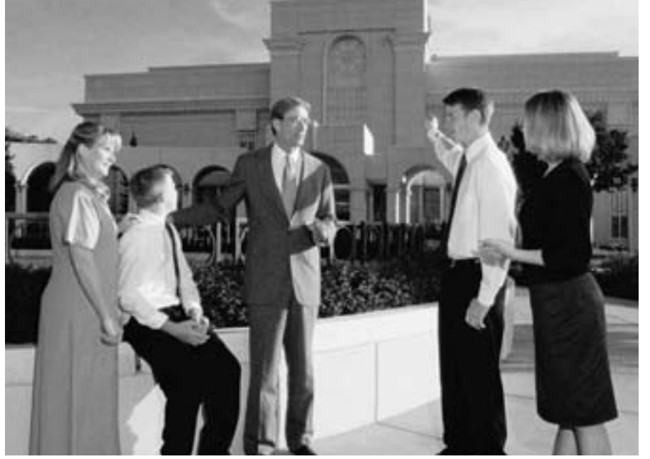
நமது தனிப்பட்ட எடுத்துக்காட்டின் மூலம் வாலிப ஆண்களும் பெண்களும் நீதியான திருமணத்தைப்பற்றி கற்றுக்கொள்ளவும் ஆயத்தப்படவும் அவர்களுக்குத் துக்கிறது நமது மிக அதிகமான பொறுப்புகளில் ஒன்று.

ஆற்றல்மிக்க ஒரு இளம் குடும்பத்தின் எண்ணிலடங்காத தகுதியான தேவைகளை நிறைவேற்ற முயற்சிப்பதிலும், சபை, தொழில் மற்றும் சமுதாய பொறுப்புகள் என்பதில், அநேக ஆண்டுகளுக்கு முன் சகோதரி பெட்னரும் நானும் ஈடுபட்டிருந்தோம். எங்களின் முக்கியமான முன்னுரிமைகளை நாங்கள் எவ்வளவு ஆற்றலு