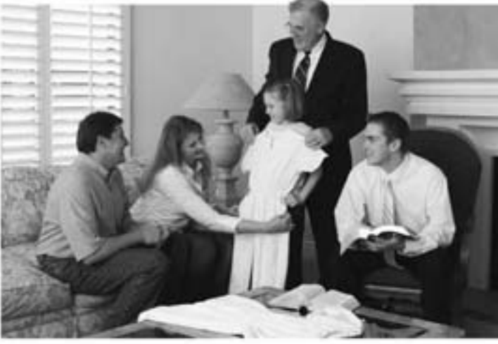
ஒரு பிள்ளையின் வாழ்க்கையில் பெற்றோரின் இடத்தை எடுத்துக்கொள்ளாமல் அவர்களை கௌரவித்து பெற்றோர்களை தலைவர்கள் ஆதரிக்கிறார்கள்.

ருக்கிறது. இப்போது, ஒத்தாசை சங்க தலைவர்களே, நீங்கள் திட்டமிடுகிற கூட்டங்களும் நிகழ்ச்சிகளும் உங்கள் சகோதரிகள் அனைவரின் வீடுகளை பலப்படுத்துகிறதாயிருப்பதை உறுதிசெய்யுங்கள்