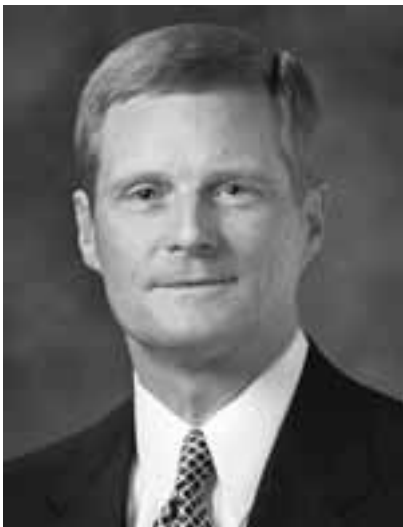
ELDER DAVID A. BEDNAR

Sa Korum sa Napulog Duha ka mga Apostoles