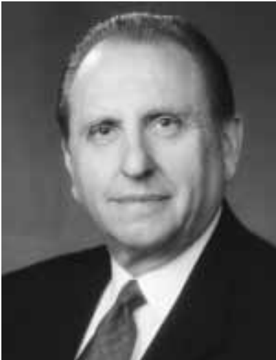
PRESIDENT THOMAS S. MONSON Unang Magtatambag sa Unang Kapangulohan