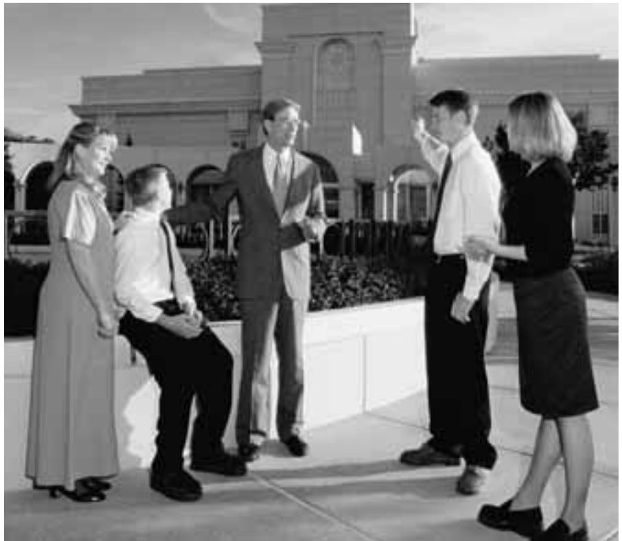
Usa sa atong pinaka-importanteng responsibilidad mao ang pagtabang sa batan-ong mga lalaki ug babaye sa pagkat-on ug pag-andam para sa matarung nga kaminyoon pinaagi sa atong personal nga ehemplo.