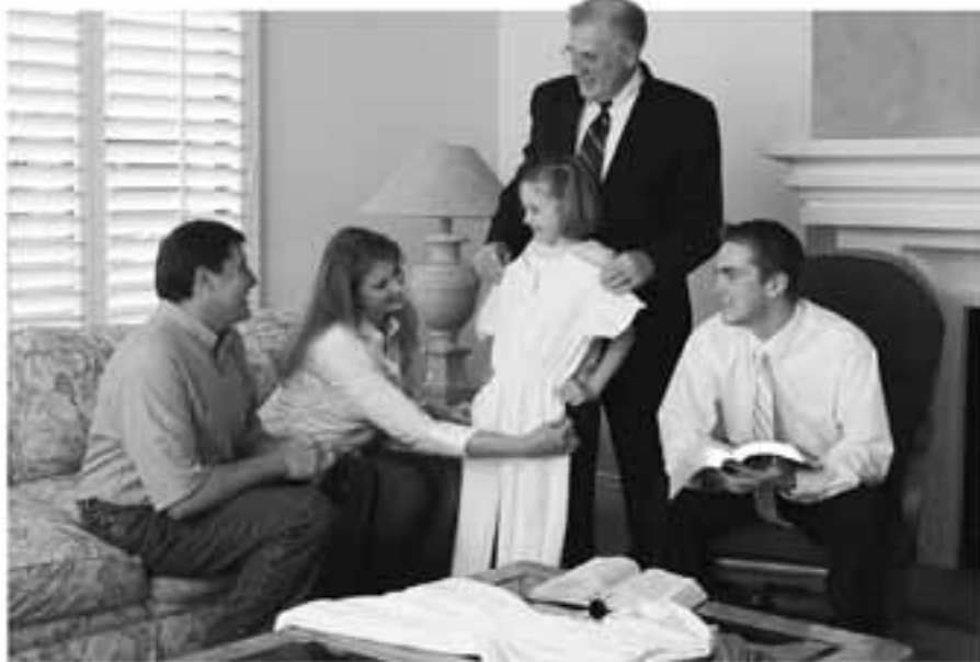
Ledere støtter forældre ved at ære dem, ikke ved at træde ind og overtage et barn.

at tilhøre organisationer, og, hvis de har overskud, få børn. Moderens ærede rolle er i stigende grad gået af mode. Lad mig gøre det klart: Vi må ikke tillade verden at bringe det i fare, som vi ved, er givet til os i henhold til en guddommelig plan.