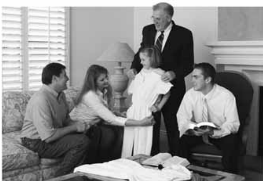
Ledere støtter foreldre ved å respektere dem, ikke ved å tre frem og overta et barn.

en blomstrende karriere, organisasjoner å tilhøre og, hvis ressursene strekker til, barn. Den hedrede morsrollen går stadig mer av moten. La meg gjøre det klart: Vi må aldri la verden få sette på spill det vi vet er gitt oss ved guddommelig forordning.