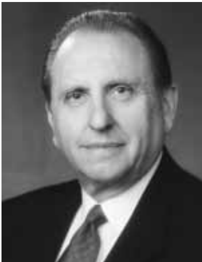
PRESIDENT THOMAS S. MONSON Førsterådgiver i Det første presidentskap