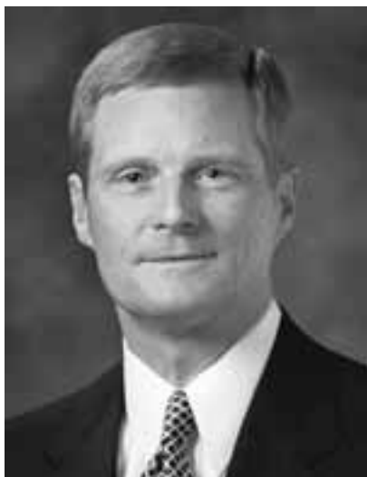
СТАРЕЙШИНА ДЭВИД А. БЕДНАР Член Кворума Двенадцати Апостолов