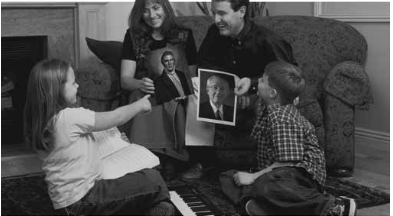
Den viktigaste undervisning som barn någonsin får bör komma från deras föräldrar.