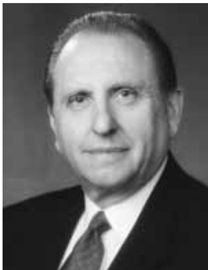
PRESIDENT THOMAS S. MONSON förste rådgivare i första presidentskapet