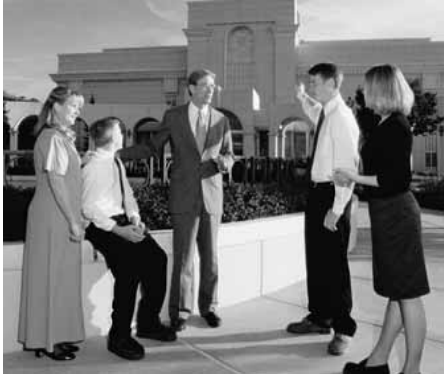
Một trong các trách nhiệm nặng nề của chúng ta là giúp các thanh niên thiếu nữ học hỏi và chuẩn bị cho hôn nhân ngay chính qua tấm gương cá nhân của chúng ta.

Cách đây nhiều năm, Chị Bednar và tôi bận rộn cố gắng đáp ứng vô số đòi hỏi khó khăn của một gia đình trẻ và đầy nghị lực—và các trách nhiệm của Giáo Hội, nghề nghiệp, và cộng đồng. Một buổi tối nọ sau khi con cái