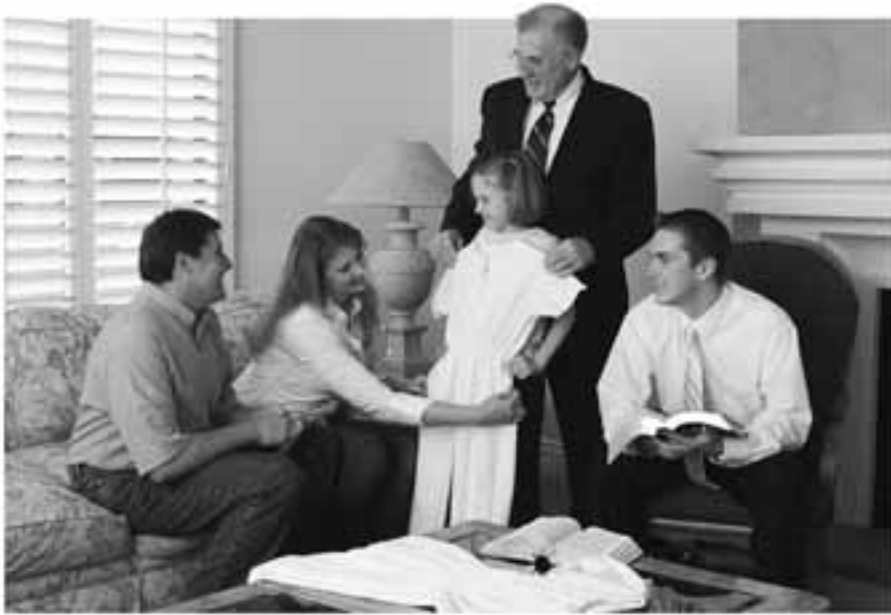
E lagolagoina e taitai ia matua i lo latou faamamaluina lea o i latou, ae le o le laa i luma e aveese le matafaioi a matua mai le olaga o se tamaitiiti.

mea e tausi ai, le fanau. Ua matua faateleina le se'e ese atu o le matafaioi mamalu a le tina. Se'i ou faamanino atu lava le mea lea: e le tatau ona tatou faatagaina le lalolagi e fetuutu-una'ia le mea ua tatou iloa, na tuuina mai ia te i tatou i le mamanu faalelagi.