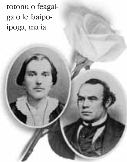
Sa faaalii e Elder Parley P. Pratt ia faamanuiaga e oo mai pe a tatou aoao, ma malamalama, ma taumafai e faaoga aoaoga faavae e uiga i le faaiipoipoga.

lava foi ona tofu sao uiga tulaga ese o tane ma fafine i le atoatoaga o se sootaga faalefaaiipoipoga, e faapena foi ona taua na lava uiga mo le tausiga, faafaileleina, ma le aoaoina o le fanau. “E tatau ona fanauina fanau i totonu o feagai-ga o le faaiipoipoga, ma ia