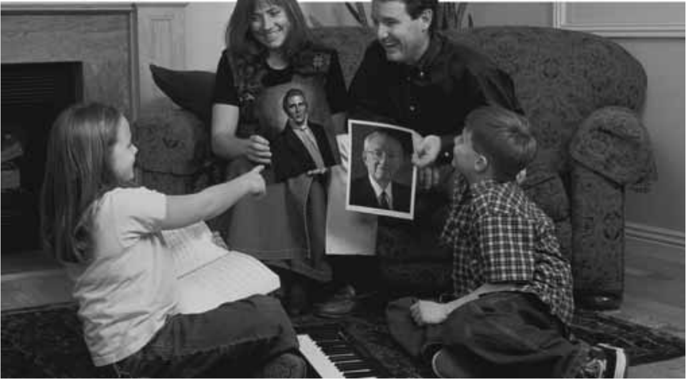
O aoaoga aupito taua e mafai ona maua e le fanau, e tatau ona maua mai lea i o latou matua.

loo e latalata atu ia i latou? O lo outou tiutetauave o ni tama ma ni tina le saunia ia lava se taimi e aoao ai i latou, aua o aoaoga aupito sili ona taua o le a maua e fanau e tatau ona sau mai o latou matua. E tatau ona tatou masani i mea o loo aoao ai a tatou fanau e le Ekalesia, ina ia mafai ai ona ogatasi a tatou aoaoga i fanau taitoatasi, ma na foi aoaoga. Mo se faataitaiga, o le tamaitusi, Mo Le Malosi o le Autalavou , i le siiina mai o le folafolaga i le aiga, o loo tuuina atu ai i tupulaga talavou le fautuaga lenei e uiga i aiga: