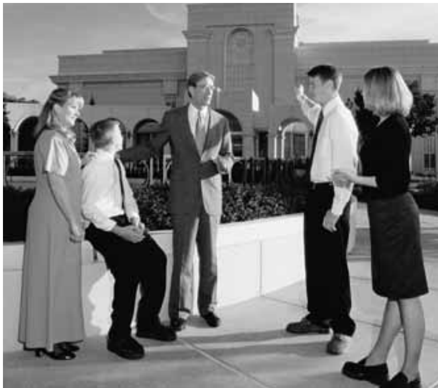
O se tasi o o tatou tiutetauave e aupito sili ona taua, o le fesoasoani lea i alii ma tamaitai talavou e aoao ma sauniuni mo se faaiipoipoga amiotonu e ala ia tatou faataitaitaiga patino.

I le tele o tausaga ua mavae, sa ma pisi ai lava ma Sister Bednar e tau faafetaia'ia le anoanoai o tulaga manaomia o se aiga talavou ma le malolosi—faapea le Ekalesia, o galuega, ma tiutetauave o le alalafaga. I se