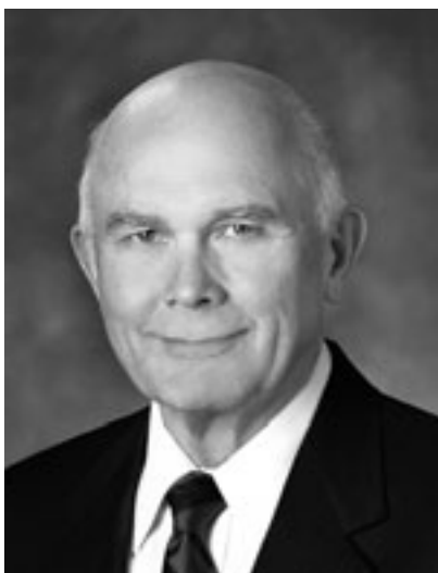
СТАРЕЙШИНА ДЖЕФФРИ Р. ХОЛЛАНД