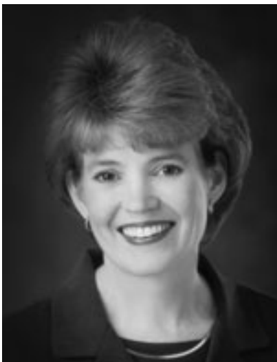
СЬЮЗЕН У. ТЭННЕР

Генеральный президент Общества молодых женщин