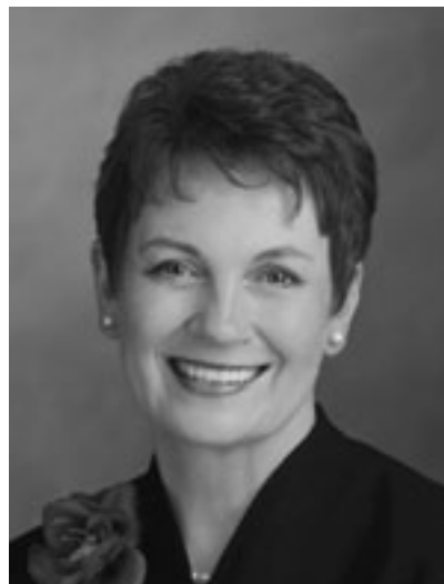
ШЕРИЛ К. ЛЭНТ

Генеральный президент Общества молодых женщин