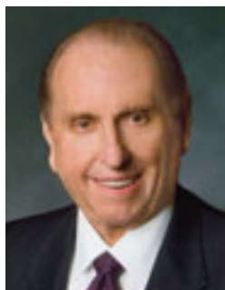
Президент Томас С. Монсон