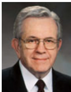
Президент Бойд К. Пэкер