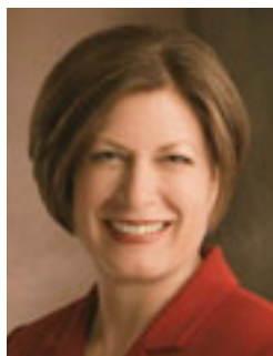
Джули Б. Бек

Генеральный президент Общества милосердия