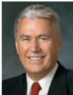
Президент Дитер Ф. Ухтдорф

Я молюсь о том, чтобы все мы познали великое Священство Аароново и то доверие, которое Бог возлагает на его носителей. Во имя Иисуса Христа, аминь. ■