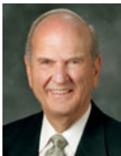
Старейшина Рассел М. Нельсон