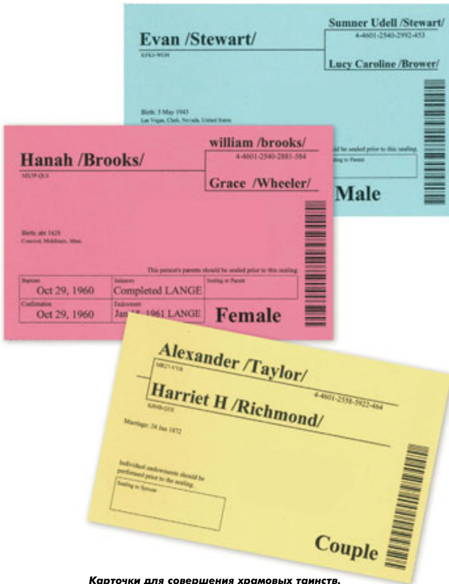
Карточки для совершения храмовых таинств.

бессмертие и жизнь вечную, то есть возвышение, Его детей 2 . «Ибо так возлюбил Бог мир, что отдал Сына Своего Единородного, дабы всякий, верующий в Него, не погиб, но имел жизнь вечную» 3 .