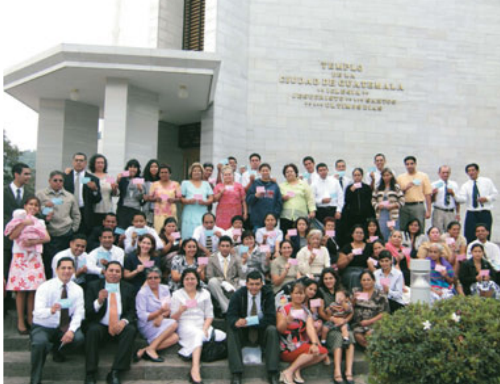
Святые из кола Илопанго, Сан-Сальвадор, Сальвадор, посещают храм в Гватемале, Гватемала.