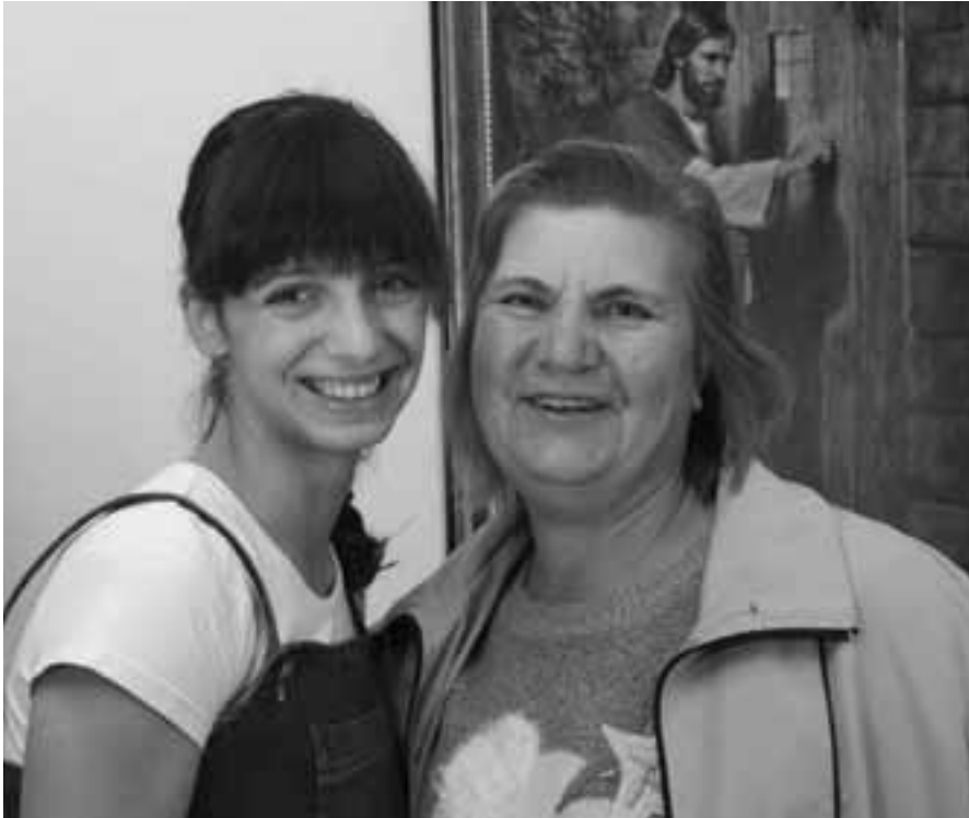
Des sœurs d'Ukraine sont heureuses d'entendre les recommandations de dirigeants de l'Église.

d'atteinte. Nous pourrions penser que c'est trop difficile, trop haut, trop exigeant et au-delà de nos capacités, du moins pour l'instant. Ne croyez jamais cela. Bien que les principes du Seigneur soient les plus élevés, ne pensez jamais qu'ils ne peuvent être atteints que par une minorité de personnes particulièrement capables.