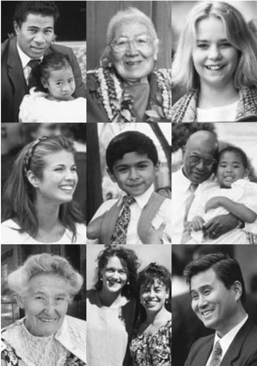
Santi degli Ultimi Giorni di tutto il mondo gioiscono delle benedizioni del Vangelo.