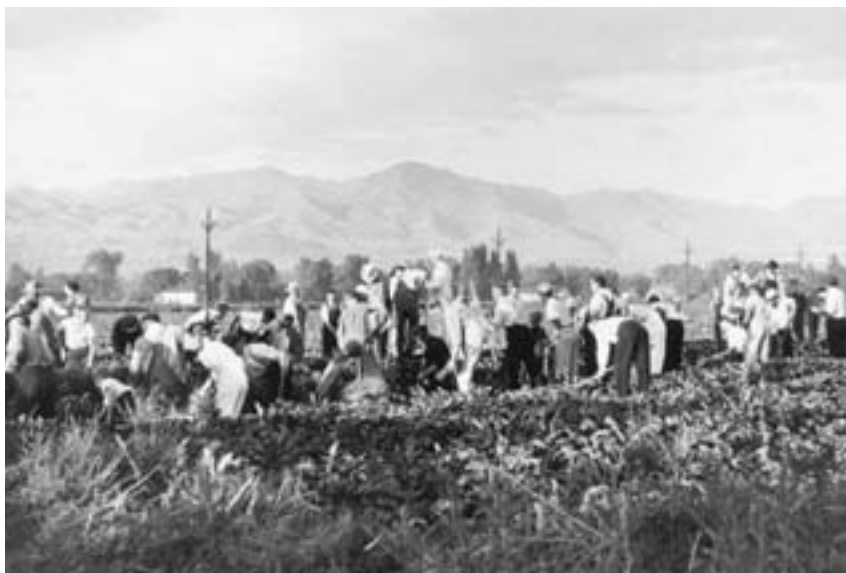
La Chiesa istituì le fattorie dei servizi di benessere per produrre il cibo necessario per le persone bisognose. I membri della Chiesa contribuivano a questo progetto con la manodopera, come vediamo fare a questi santi al lavoro in una fattoria coltivata a barbabietola da zucchero nel 1933.

lasciò scoraggiare, ma dedicò molte ore a esercitarsi in calligrafia. Diventò molto noto per la sua capacità di scrivere bene, e infine tenne un corso di calligrafia in un'università. Spesso era chiamato a scrivere documenti importanti. Egli dava il buon esempio a molte persone, con la sua determinazione di fare del suo meglio nel servire il Signore e il prossimo.