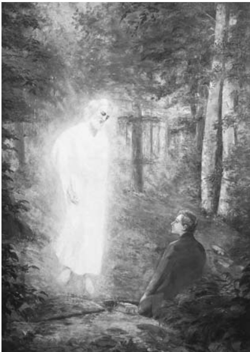
Alla collina di Cumora Joseph Smith ricevette le tavole d'oro dall'angelo Moroni e gli fu comandato di iniziare il lavoro di traduzione.