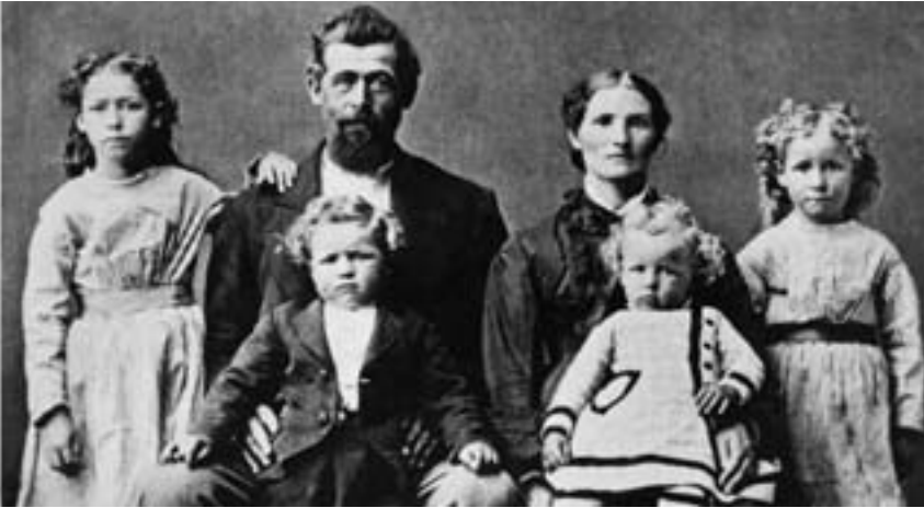
Il presidente David O. McKay da bambino con la sua famiglia, seduto sulle ginocchia di suo padre.