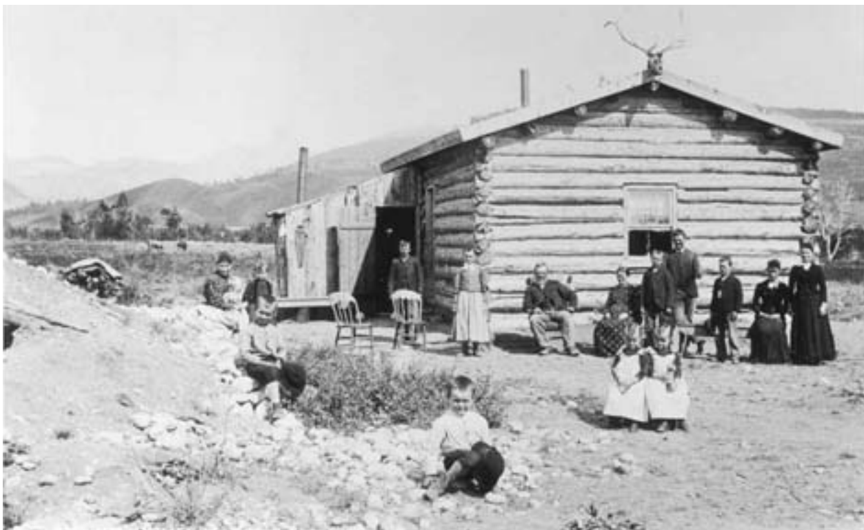
Rispondendo alla chiamata del presidente Brigham Young, molti santi lasciavano le loro case per colonizzare nuove regioni.