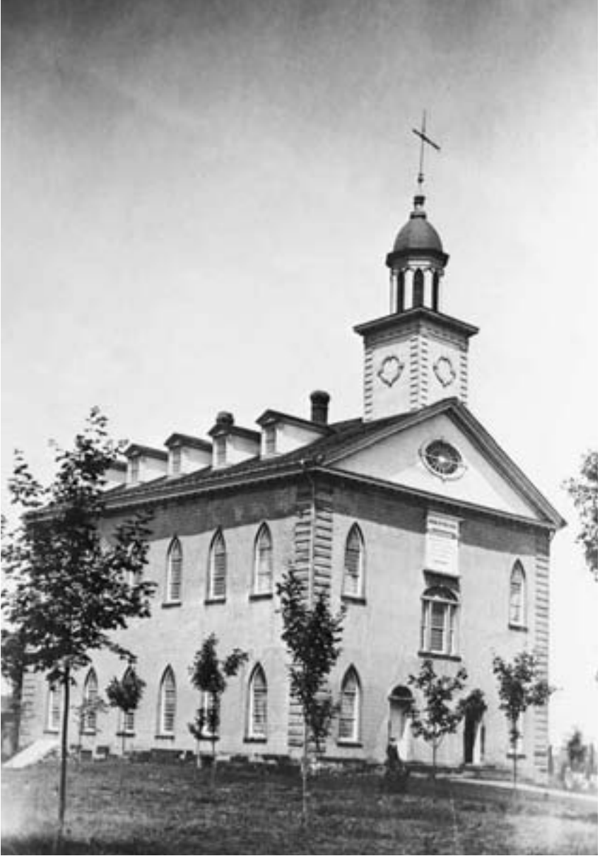
Il Tempio di Kirtland