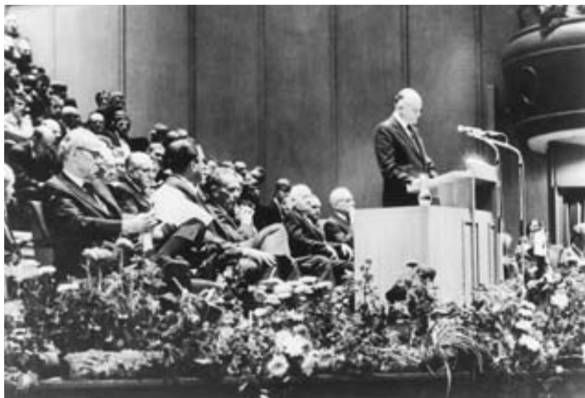
La prima conferenza di area della Chiesa fu tenuta in Inghilterra nell'agosto 1971 sotto la direzione del presidente Joseph Fielding Smith. Qui vediamo l'anziano Howard W. Hunter al pulpito.

furono chiamati i missionari dei servizi sanitari allo scopo di insegnare i principi fondamentali dell'igiene e della sanità. Presto più di duecento missionari dei servizi sanitari furono al lavoro in molti paesi.