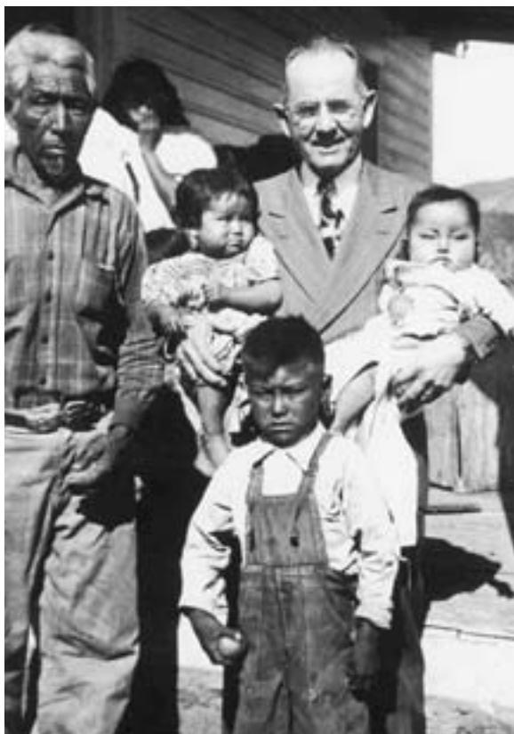
Il presidente Spencer W. Kimball tra gli Indiani nella parte sud occidentale degli Stati Uniti

rare le loro condizioni. Egli aveva ricevuto una benedizione dal presidente George Albert Smith che gli chiedeva di vegliare su queste persone, e come presidente della Chiesa designò alcuni membri del Quorum dei Dodici perché dedicassero o ridedicassero i paesi dell'America centrale e meridionale alla predicazione del Vangelo. Da allora decine di migliaia di persone nell'America centrale e meridionale hanno gioito delle benedizioni del Vangelo.