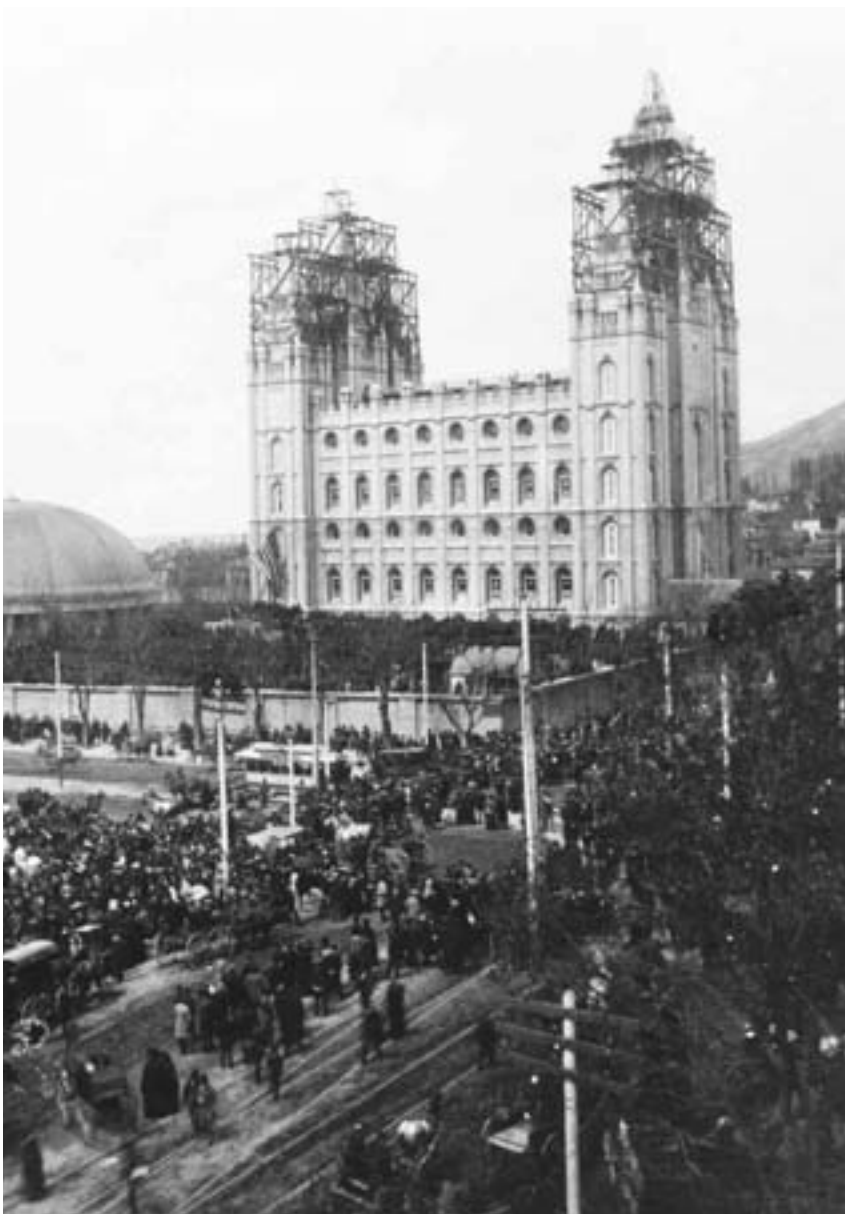
Migliaia di santi si radunarono per assistere alla posa della pietra di copertura del Tempio di Salt Lake, il 6 aprile 1892.