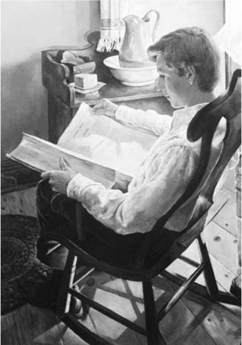
La lettura delle Scritture indusse il giovane Joseph Smith a chiedere al Signore quale chiesa fosse quella giusta.