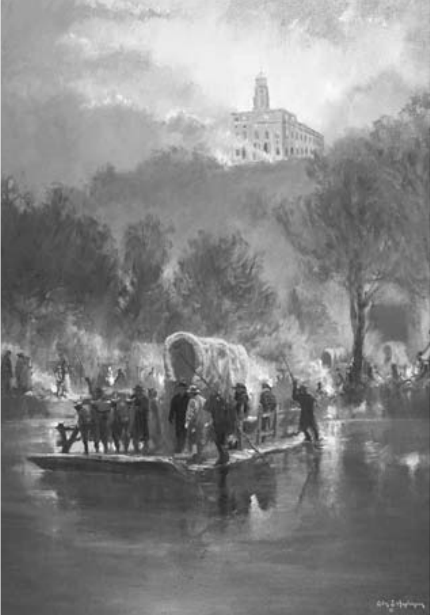
I santi furono obbligati dalle violenze della plebaglia a lasciare la loro amata città di Nauvoo.