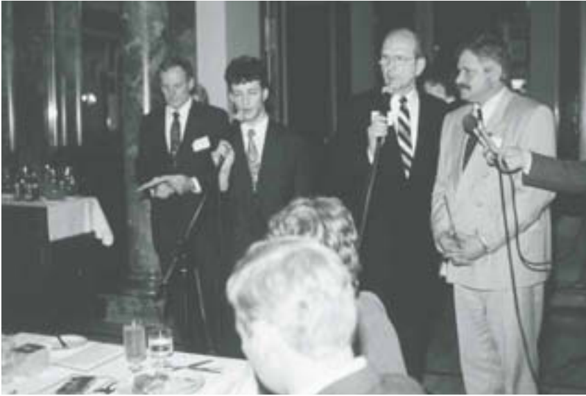
La dedicazione della casa di riunione dei Santi degli Ultimi Giorni a Varsavia, in Polonia, il 22 giugno 1991. Cappelle come questa, che sorgono in molti paesi, forniscono un rifugio di pace ai membri della Chiesa

settimana dopo fu battezzato dopo aver ascoltato le lezioni missionarie, letto per due volte il Libro di Mormon dalla prima all'ultima pagina e acquisito una forte testimonianza della veridicità del Vangelo. 5