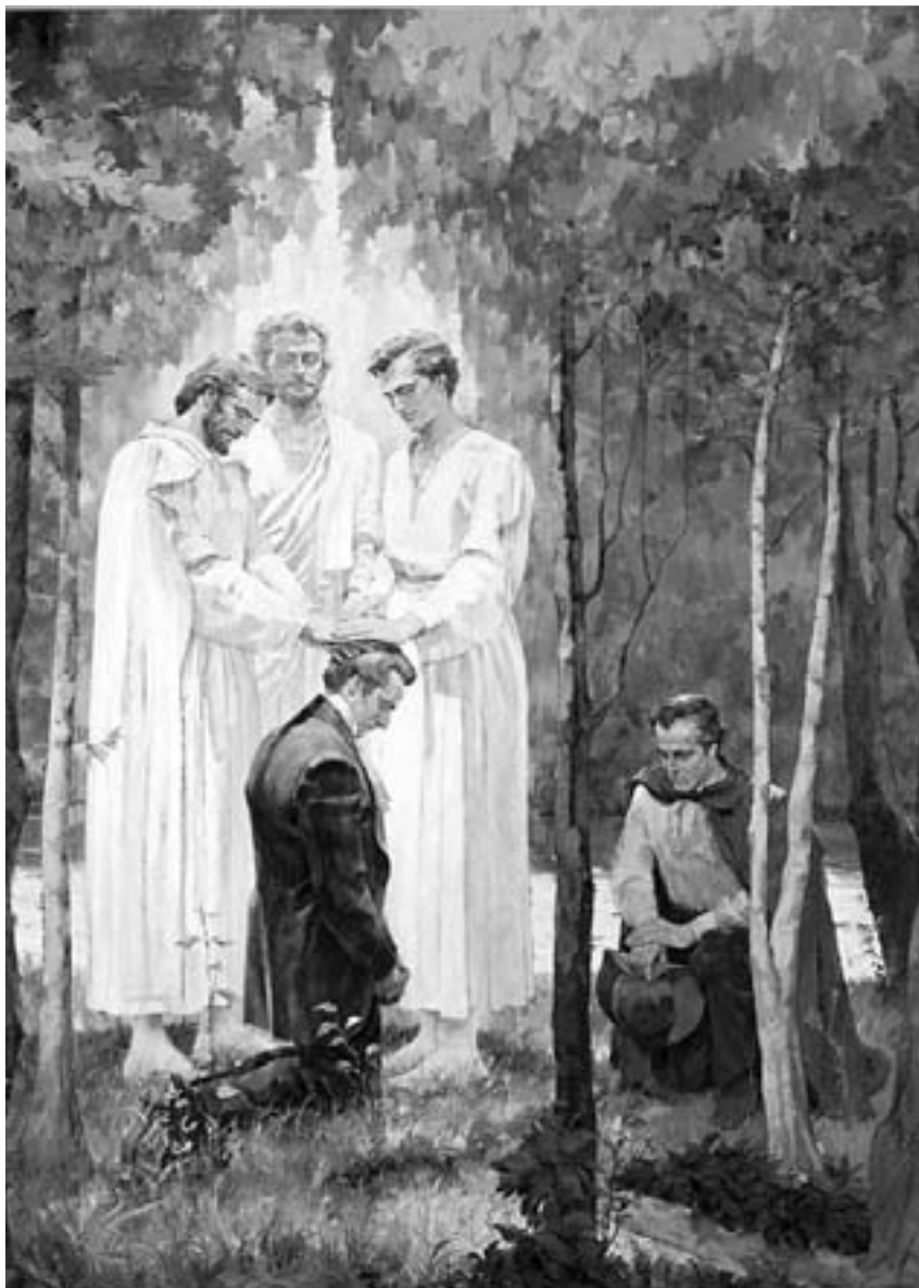
Pietro, Giacomo e Giovanni apparvero a Joseph Smith e Oliver Cowdery e conferirono loro il Sacerdozio di Melchisedec.