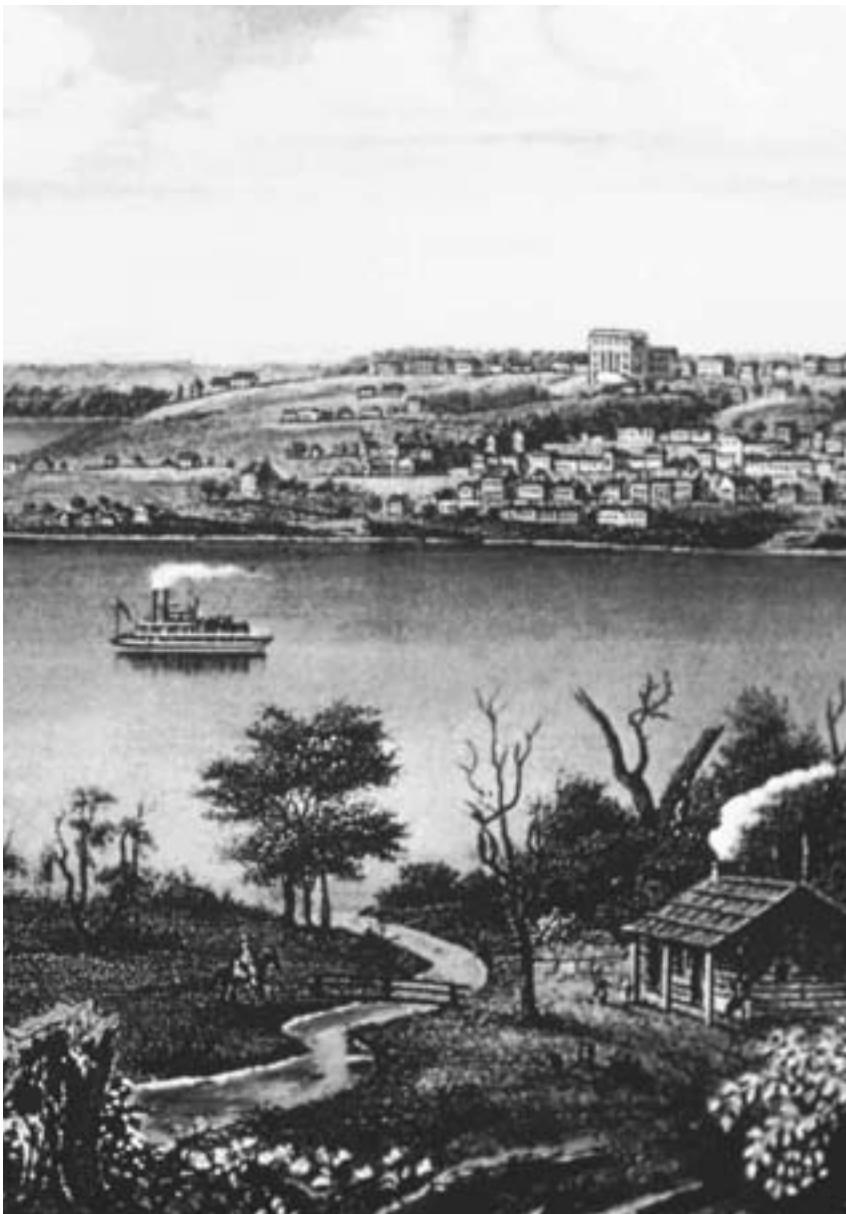
I santi edificarono la bella città di Nauvoo lungo le sponde del Fiume Mississippi. Il Tempio di Nauvoo domina la città.