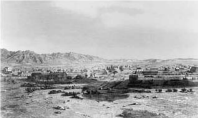
Forti nella loro fede e laboriosità, i santi cominciarono a fondare una città nella Valle del Lago Salato. Questa incisione mostra la valle come appariva nel 1853.

I santi lavoravano con energia e fede nonostante la difficile situazione, e presto riuscirono a compiere grandi progressi. Un viaggiatore diretto in California passò per Salt Lake City nel settembre 1849 e tessè le lodi dei santi con queste parole: «Non ho mai veduto un popolo più ordinato, sincero, laborioso e civile di questo; è incredibile quanto fanno qui nel deserto in un periodo di tempo tanto breve. In questa città, che conta da quattro a cinquemila abitanti, non ho visto un cittadino ozioso né una persona che avesse l'aspetto di un indolente. Le prospettive di un buon raccolto sono ottime e in tutto ciò che si vede si nota uno spirito e un'energia che non hanno l'uguale in nessun'altra città delle stesse dimensioni in cui sono stato». 4