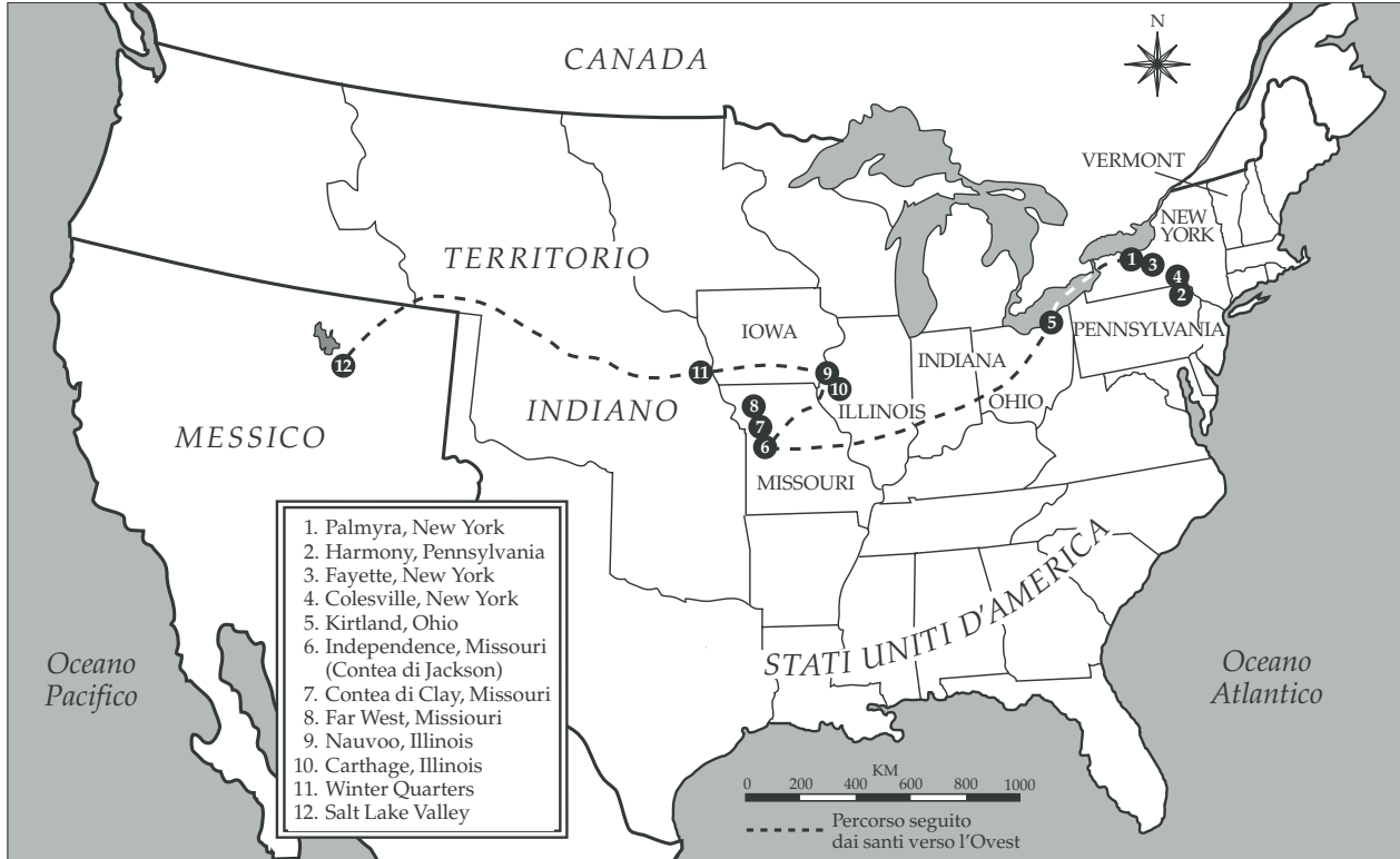
Gli Stati Uniti d'America nel 1847. La cartina indica le località e le vie di comunicazione più importanti agli inizi della storia della Chiesa.