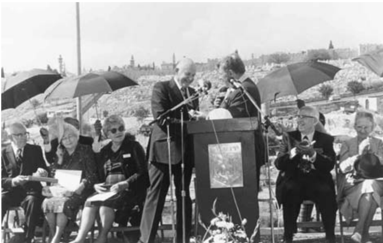
La dedicazione del monumento a Orson Hyde a Gerusalemme.