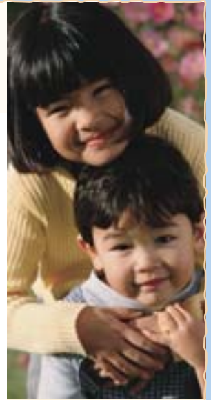
Foto Laat de foto op pagina 10 zien, wijs naar een kind op de foto en vraag: 'Is dit een kind van God?' Knik en zeg ja. Herhaal dat voor ieder kind op de foto. Wijs dan naar uzelf en vraag: 'Ben ik een kind van God?'

Herhaling Laat een kind voor de klas naast u gaan staan. Zeg: 'Dit is [naam van het kind].' Laat de kinderen de naam van het kind herhalen. Zeg: '[Naam van het kind] is een kind van God.' Laat de kinderen herhalen: '[Naam van het kind] is een kind van God.' Herhaal dit met ieder kind in de kinderkamer. Als de kinderkamer groot is, kunt u twee kinderen tegelijk nemen of deze activiteit zo nodig inkorten.