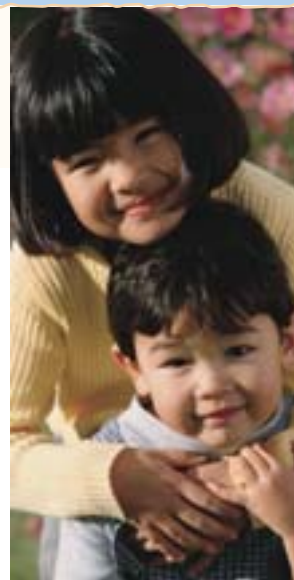
Bild Visa bilden på sidan 10, peka på ett av barnen på bilden och fråga: "Är den här personen ett Guds barn?" Nicka och säg ja. Upprepa för varje barn på bilden. Peka sedan på dig själv och fråga: "Är jag ett Guds barn?" Nicka och säg ja. Säga att alla är Guds barn och han känner och älskar oss alla.

Upprepa aktiviteten för varje barn i barntillsynen. Om du har en stor barntillsyn kan du presentera två barn åt gången eller förkorta aktiviteten efter behov.