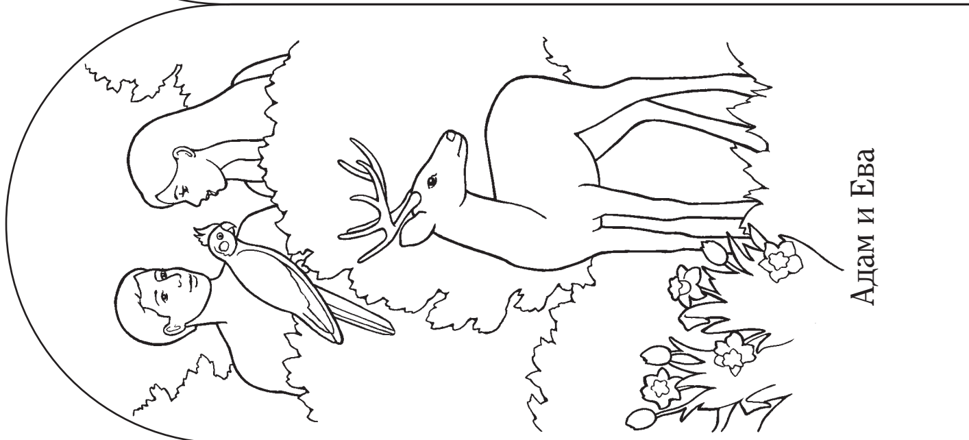
Адам и Ева