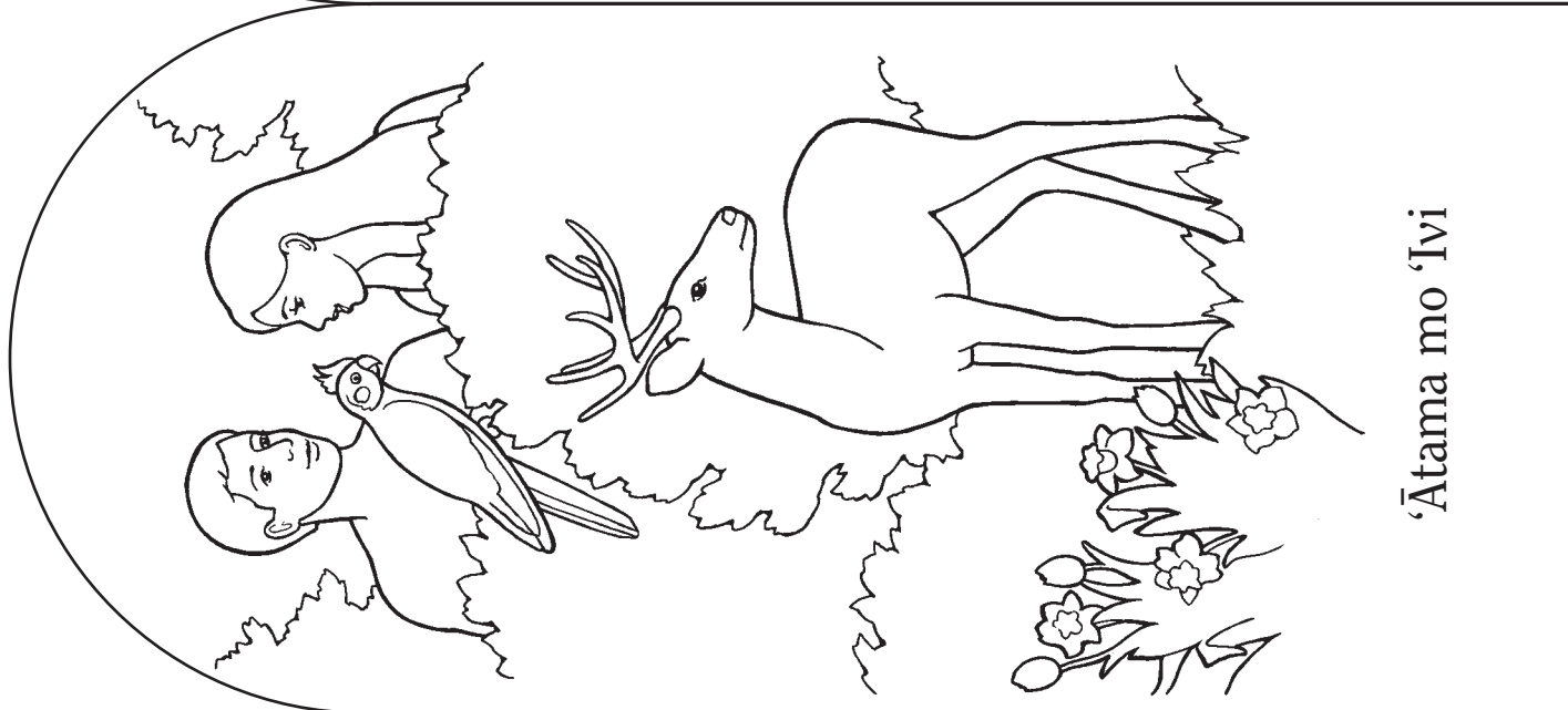
‘Ātama mo ‘Ivi