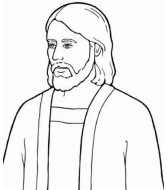
Sakramen menolong saya memikirkan tentang Yesus Kristus