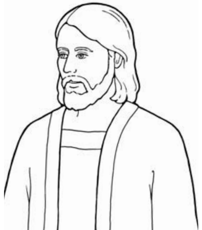
Tinutulungan ako ng sacrament na isipin si Jesucristo.