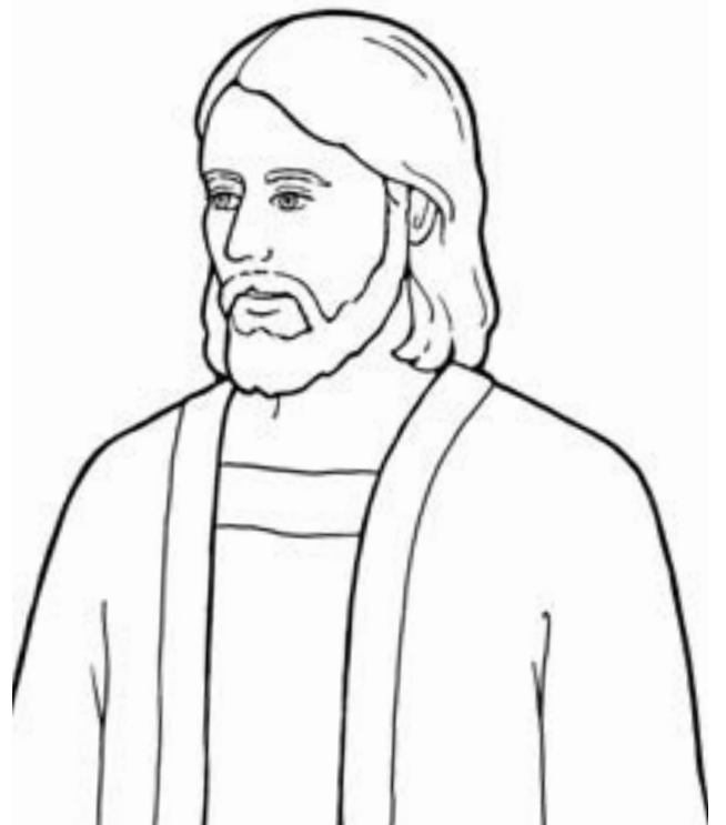
'Oku tokoni'i au 'e he sākalamēnití ke u fakakaukau kia Sīsū.