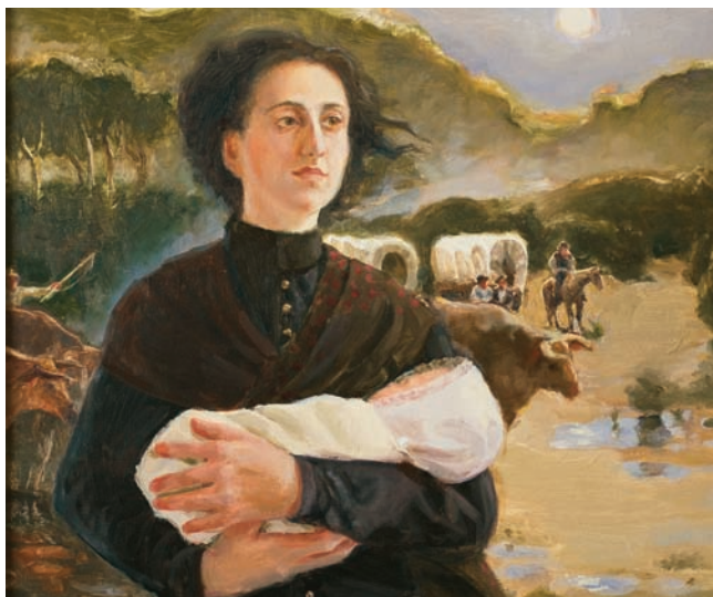
Parteira: Teu Caminho, a Senda Escolhida por Ela, de Crystal Haueter

Quão autossuficientes são as irmãs na sua ala? Como você pode discernir suas necessidades? E quem deve ajudar a presidente da Sociedade de Socorro nesses esforços? Por ser esta uma obra divina e por ter a presidente da Sociedade de Socorro um chamado divino, ela tem direito à ajuda divina. Ela também conta com a ajuda de boas professoras visitantes que entendem sua responsabilidade de cuidar das irmãs. Por meio dos relatórios que ela recebe delas e de outras irmãs, é capaz de saber quais são as necessidades das irmãs. Ela também pode usar a ajuda de comitês e de irmãs mais jovens, que têm muita energia e estão prontas a servir.