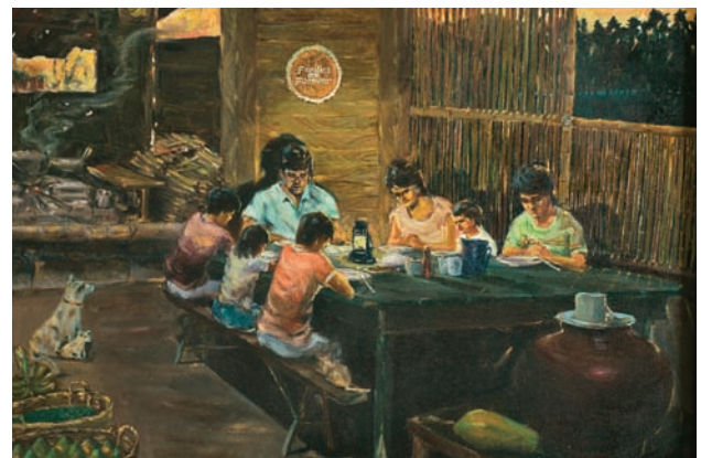
A Oração Familiar, de Abelardo Loria Lovendino, cortesia do Museu de História da Igreja

Tenho visto grandes exemplos de irmãs em todo o mundo ajudando umas às outras a tornarem-se autossuficientes. Nos Estados Unidos, as irmãs estão se reunindo para aprender como fazer um orçamento a fim de comprar com cuidado e reduzir as dívidas. Irmãs mais velhas estão ajudando irmãs mais novas a cozinhar e a preparar refeições saudáveis em casa. Em Gana, as irmãs aprendem a ler juntas. No Peru, as irmãs empacotam hermeticamente arroz e feijão para que não passem fome quando ocorrerem os terremotos. Nas Filipinas, onde os tufões ocorrem com regularidade, as irmãs fazem armazenamento de curto prazo de suprimentos e alimentos para usar quando precisarem sair de seus lares.