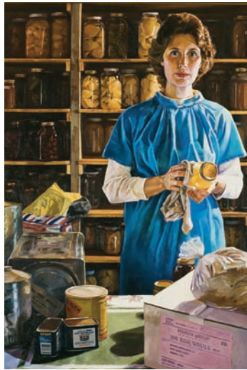
Mulher com Armazenamento de Alimentos, de Judith A. Mehr

problemas”. 5 Cada um de nós tem a responsabilidade de tentar evitar problemas antes que ocorram e aprender a superá-los quando ocorrem.