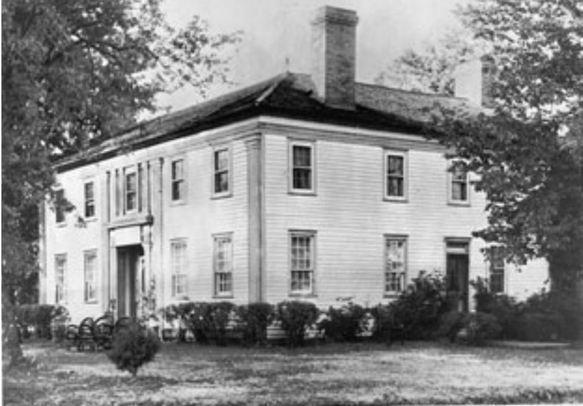
Das „Mansion House“ in Nauvoo. In dieses Haus zog der Prophet Joseph Smith mit seiner Familie im August 1843.

Verpflichtungen in der Kirche und im Gemeinwesen einen Großteil seiner Zeit beanspruchten, hatte der Prophet oft Mühe, für die materiellen Bedürfnisse seiner Familie zu sorgen. Im Oktober 1841 konnte sein gesamter Besitz folgendermaßen zusammengefasst werden: „Old Charley (ein Pferd), das ihm in Kirtland geschenkt worden war, zwei zahme Rehe, zwei alte und vier junge Truthähne, eine alte Kuh, die ihm ein Bruder in Missouri geschenkt hatte, sein treuer Major (ein Hund) ... und die wenigen Möbel im Haus“ 12 .