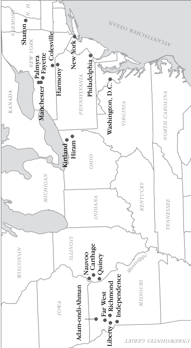
Wichtige Orte der frühen Geschichte der Kirche und im Leben des Propheten Joseph Smith.