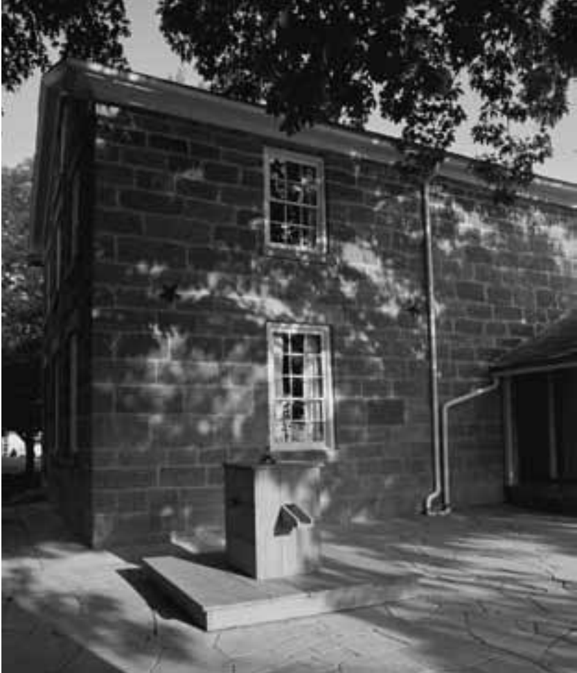
Das Gefängnis in Carthage, wo der Prophet Joseph Smith und sein Bruder Hyrum am 27. Juni 1844 den Märtyrertod erlitten.

Kaution freigelassen, doch sofort wegen Hochverrats gegen den Staat Illinois angeklagt und ins örtliche Gefängnis geworfen.