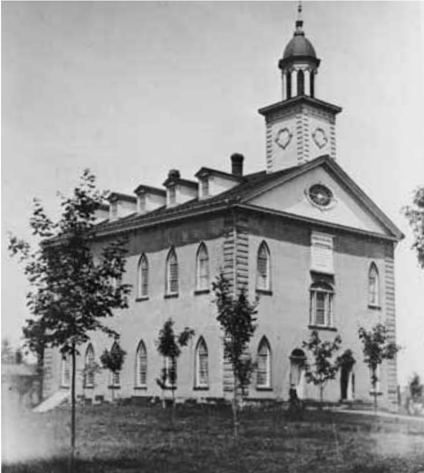
Der Kirtland-Tempel um 1900. Für den Bau dieses Tempels mussten die Heiligen große Opfer bringen, doch sie mussten ihn aufgeben, als sie aus Kirtland vertrieben wurden.

erworben hatte. Alle diese Übersetzungen wurden später Teil der Köstlichen Perle.