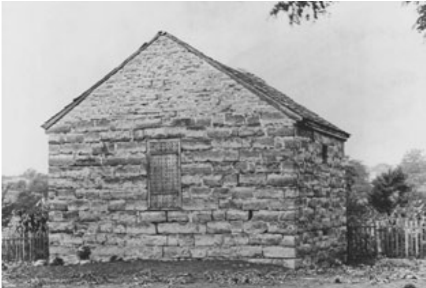
Das Gefängnis in Liberty, in dem der Prophet Joseph Smith im Winter 1838/39 eingesperrt war.

Leider fanden die Heiligen im Norden Missouris nur kurz Frieden. Im Herbst 1838 wurden die Heiligen der Letzten Tage erneut von Mobs und von der Bürgerwehr schikaniert und angegriffen. Als Mitglieder Vergeltung übten und sich selbst verteidigten, wurden Joseph Smith und andere Führer der Kirche des Hochverrats beschuldigt und festgenommen. Im November saßen sie in Independence und später in Richmond im Gefängnis, bis sie am 1. Dezember in das Gefängnis von Liberty gebracht wurden. Der Prophet und seine Begleiter verbrachten den Winter unter unmenschlichen Bedingungen und litten sehr. Sie wurden im Gefängniskerker festgehalten – einem dunklen, kalten und schmutzigen Keller –, und das Essen, das man ihnen vorsetzte, war so schlecht, dass sie erst aßen, wenn der Hunger sie dazu