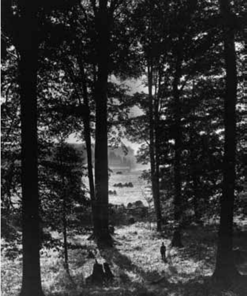
Der heilige Hain um 1907. Im Frühling 1820 ging der junge Joseph Smith in diesen Wald in der Nähe seines Zubauses, um den Herrn um Führung zu bitten.

und sagte: „Dies ist mein geliebter Sohn. Ihn höre!“ (Joseph Smith – Lebensgeschichte 1:17.)