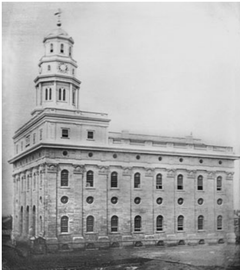
Der Nauvoo-Tempel um 1845. Dieser Tempel wurde nach der Vertreibung der Heiligen aus Nauvoo im Jahre 1848 niedergebrannt, und ein Tornado zerstörte einige Mauern, bis nur noch eine Ruine übrig blieb, die schließlich abgerissen wurde.

aus Holz ein. Am 21. November 1841 wurden in diesem Becken erstmalig Taufen für Verstorbene vollzogen.