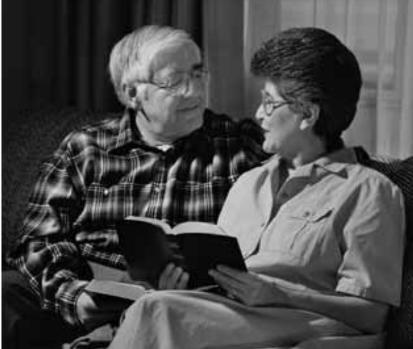
후기의 경전은 “마음이 정직한 자들이 격려와 위안을 얻고 기쁘게 길을 가도록 하기 위해” 출판되었다.

“우리는 성스러운 기록을 받아들이며, 이 기록이 인간의 유익을 위하여 하나님의 직접적인 영감으로 주어졌다는 것을 인정합니다. 우리는 하나님께서 하늘에서 말씀하시고, 인류에 관한 그분의 뜻을 선포하시고 그들에게 공의롭고 거룩한 율법을 주시며, 그들의 행동을 규제하시고 그들을 바른 길로 인도하시어 때가 되면 그들을 그분 앞으로 이끌어 그분의 아들과 함께 한 상속자로 만들기 위해 은혜를 베푸셨음을 믿습니다.