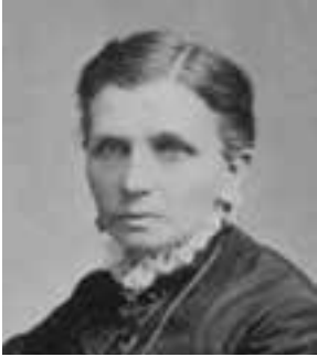
Emmeline B. Wells

Emmeline B. Wells: „Ich konnte im Propheten Joseph Smith die große geistige Kraft erkennen, die den Heiligen Freude und Trost brachte. ... Die Macht Gottes ruhte so reichlich auf ihm, dass er bei vielen Gelegenheiten verklärt zu sein schien. Sein Gesichtsausdruck war mild und, wenn er entspannte, fast kindlich. Wenn er zu den Menschen sprach, die ihn liebten und geradezu verehrten, leuchtete sein Gesicht unbeschreiblich. Ein andermal schien die machtvolle Art seines Auftretens mehr noch als seine Stimme (die für mich ausgesprochen wortgewaltig war) den Boden, auf dem wir standen, zu erschüttern und seine Zuhörer im Innersten zu berühren. Ich bin sicher, dass sie damals bereit gewesen wären, ihr Leben zu geben, um ihn zu verteidigen. Wie verzaubert lauschte ich jedem seiner Worte – dem Auserwählten Gottes in dieser letzten Evangeliumszeit.“ 31