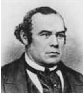
Parley P. Pratt

Parley P. Pratt, Mitglied des Kollegiums der Zwölf Apostel von 1835 bis 1857: „Präsident Joseph Smith war von hohem und edlem Wuchs, stark und lebhaft. Er hatte eine helle Hautfarbe, blondes Haar, blaue Augen, spärlichen Bartwuchs und einen einzigartigen Gesichtsausdruck. ... Er blickte stets milde und freundlich und strahlte Intelligenz und Güte aus, dabei hatte er