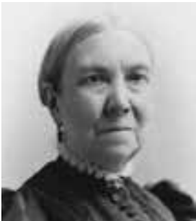
Bathsheba W. Smith

“Denodada y valerosamente enfrentó las tradiciones falsas, las supersticiones, las religiones, el fanatismo y la intolerancia del mundo, probando ser fiel a todo principio revelado por el cielo, fiel a sus hermanos y fiel a Dios; y luego selló su testimonio con su sangre” 7 .