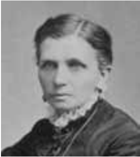
Emmeline B. Wells

Nosotros, al igual que los primeros santos, podemos atesorar las palabras de José Smith y vivir de acuerdo con los principios que él enseñó.