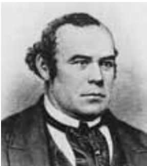
Parley P. Pratt

Parley P. Pratt, miembro del Quórum de los Doce Apóstoles desde 1835 hasta 1857: “El presidente José Smith era alto y de buena complexión, fuerte y activo; tenía el cutis y el cabello claros, los ojos azules, poca barba y una expresión en los ojos que le era peculiar... Su rostro era siempre bondadoso, afable, irradiando inteligencia y benevolencia mezcladas con una mirada de