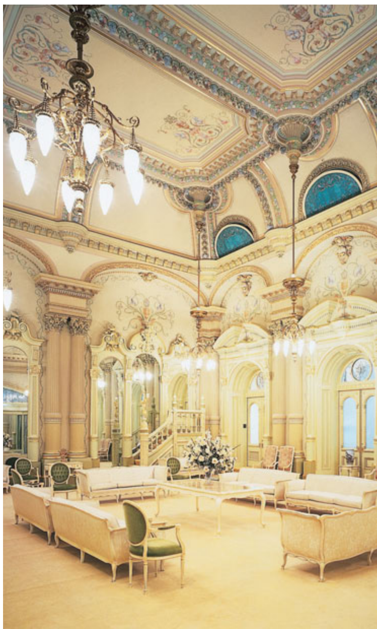
해의 왕국실, 솔트레이크 성전