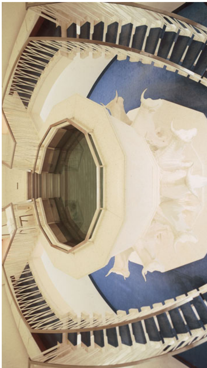
침례관, 위싱턴 도시 성전