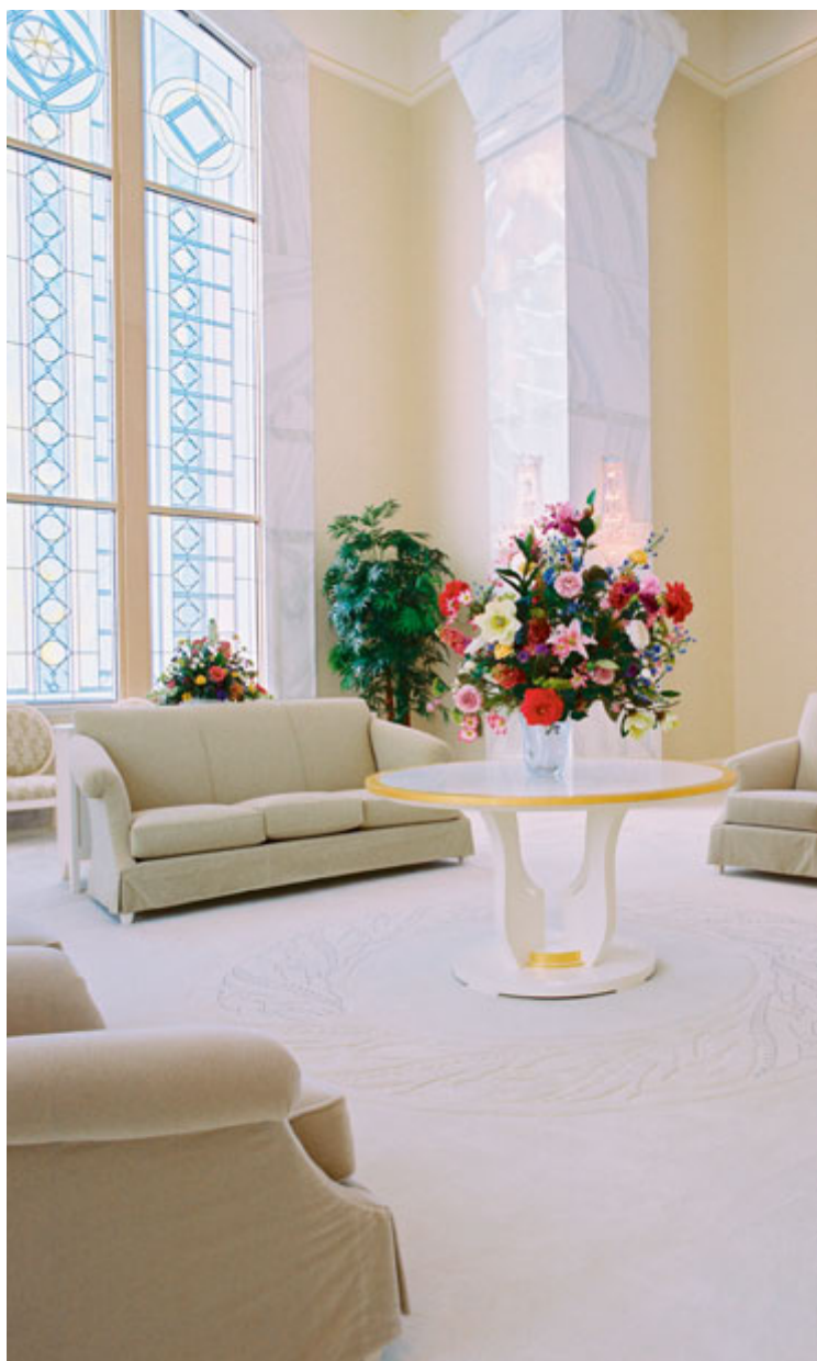
해의 왕국실, 워싱턴 컬럼비아 리버 성전