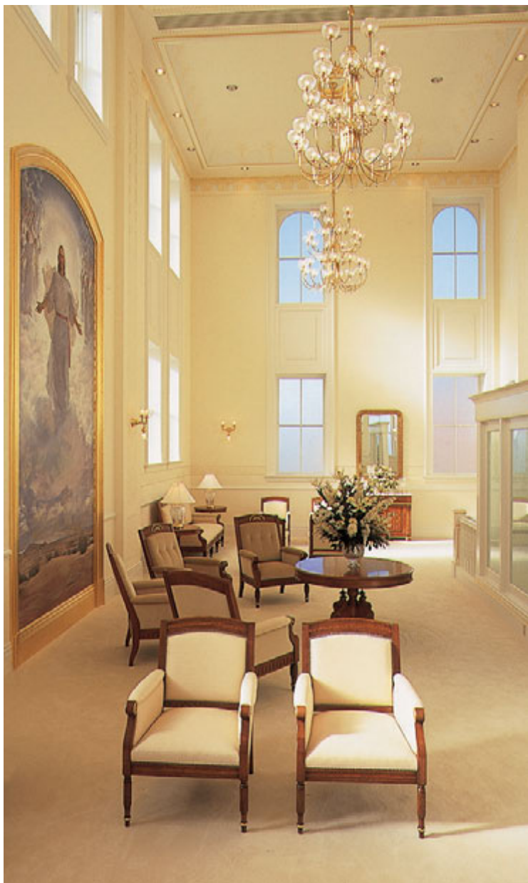
해의 왕국실, 유타 버널 성전