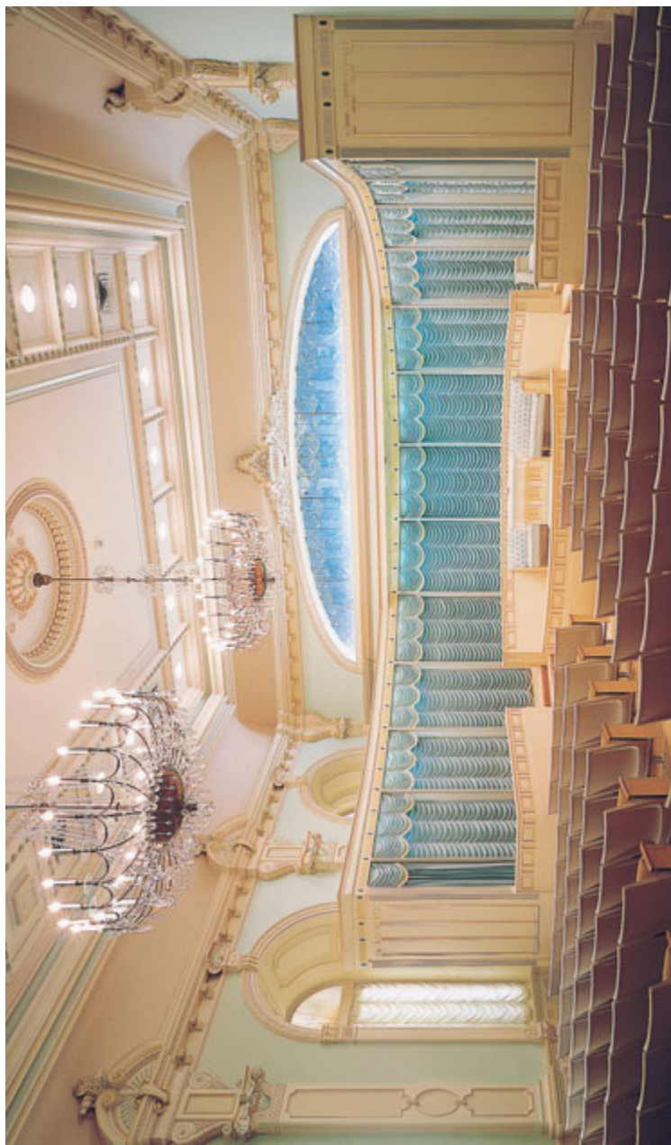
달의 앙국실, 솔트레이크 성전