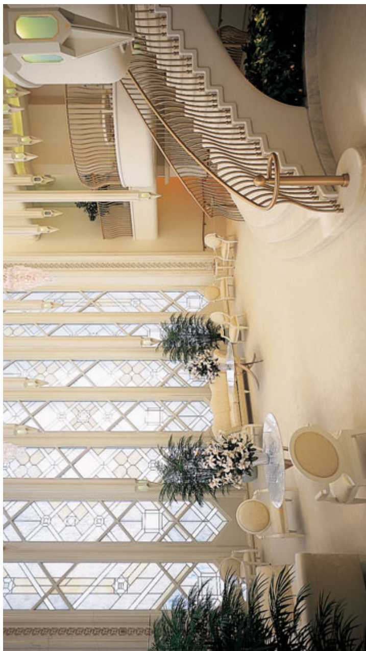
헤이 왕궁실, 캘리포니아 샌디에이고 성전