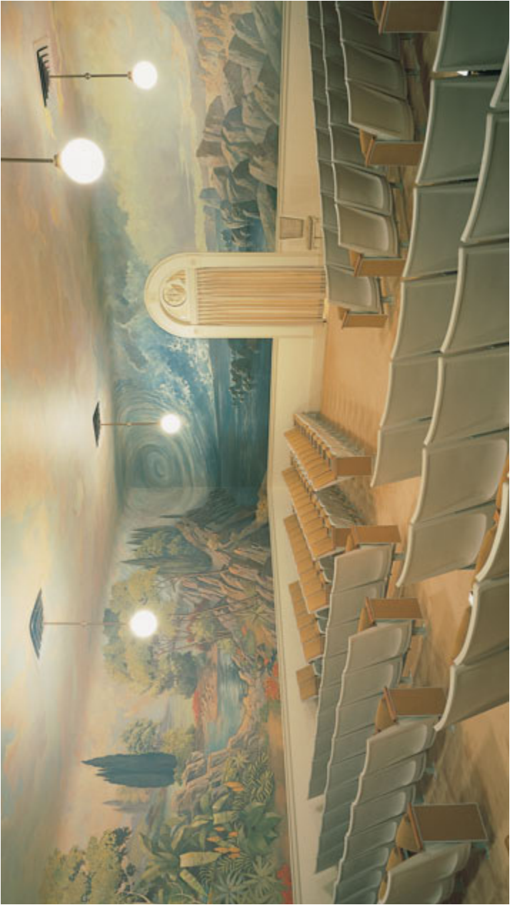
창조실, 슬트레이크 성진