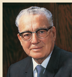
Harold B. Lee 1972–1973