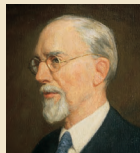
George Albert Smith 1945–1951