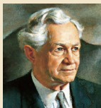
David O. McKay 1951–1970