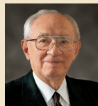
Gordon B. Hinckley 1995–2008