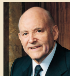
Howard W. Hunter 1994–1995