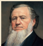
Brigham Young 1844–1877