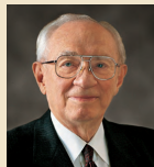
Gordon B. Hinckley 1995–2008