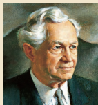
David O. McKay 1951–1970