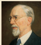
George Albert Smith 1945–1951