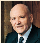
Howard W. Hunter 1994/1995