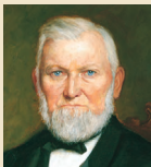
Wilford Woodruff 1887–1898