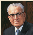
Harold B. Lee 1972/1973