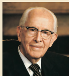
Эзра Тафт Бэнсон 1985–1994