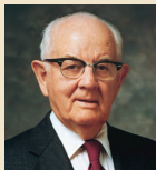
Спэнсэр В.Кимбалл 1973–1985