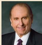
Томас С.Монсон 2008–