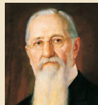
Иосеф Ф.Смит 1901–1918