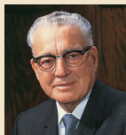
Харолд Б.Лий 1972–1973