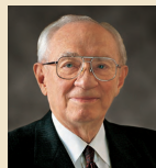
Гордон Б.Хинкли 1995–2008