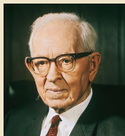
Иосеф Фийлдинг Смит 1970–1972