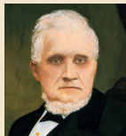
Жон Тэйлор 1877–1887