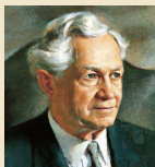
Дэвид О.Маккэй 1951–1970