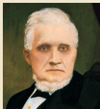
John Taylor 1877-1887