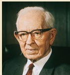
Joseph Fielding Smith 1970-1972