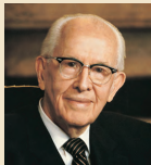
Ezra Taft Benson 1985-1994