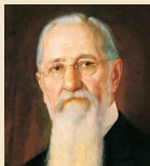
Joseph F. Smith 1901-1918