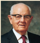
Spencer W. Kimball 1973-1985