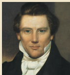
Joseph Smith 1830-1844