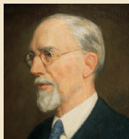
Siaosi Alapati Samita 1945–1951