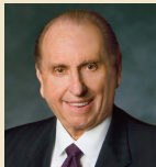
Thomas S. Monson 2008–