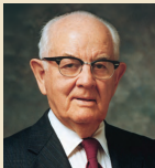
Spencer W. Kimball 1973–1985