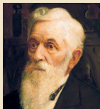
Lorenzo Snow 1898–1901