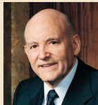
Howard W. Hunter 1994–1995