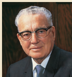
Harold B. Lee 1972–1973