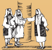
바리새인들을 꾸짖고 성전에서 가르침