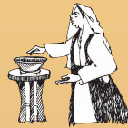
과부의 헌금에 대해 가르침