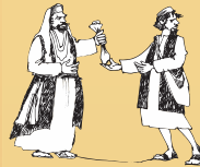
유대인 지도자들과 유다가 예수님을 체포하려고 모의함