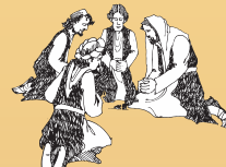
중보 기도를 드림