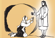
부활 및 막달라 마리아에게 나타남