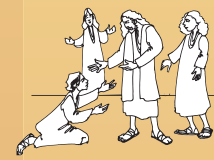
영의 세계에서 성역을 베풀