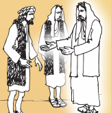
사도들과 그 밖의 사람들에게 나타남