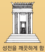
성전을 깨끗하게 함