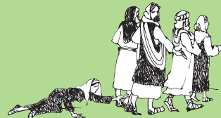
Faamalolo le fafine o i ai se puna toto