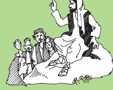
Lauga i luga o le Mauga