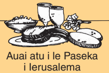
Auai atu i le Paseka i Ierusalem