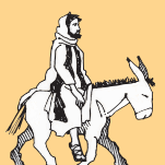
Ulufale manumalo ma le vaiaso mulimuli