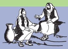
Aoao atu le fafine i le vaieli