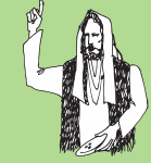
Lauga i le Areto o le Ola