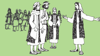
Valaauina ma auina atu ia Fitugafulu