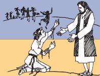
Faamalolo ia lepela e toasefulu