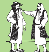
Folafola atu ia Peteru ia ki o le malo