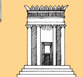
Faamamaaga muamua o le malumalu