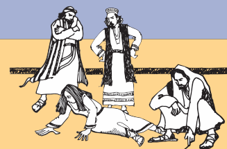
Teena le faasalaina o le fafine ua molia i le mulilua