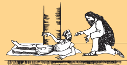
Faamalolo le tamaloa i le Vaitaele i Petesa