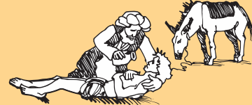
Aoao atu le faataoto o le Samaria agalelei