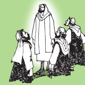
Mauga o Liua