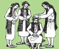
Faauuina Aposetolo e toasefululua