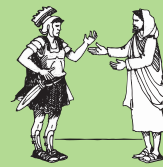
Faamalolo le auuuna a le taitai a le toaselau