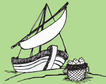
Valaauina ia soo