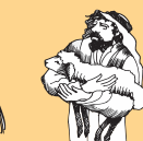
Aoao atu faataoto i e ua leiloloa