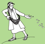
Aoao atu faataoto o le malo