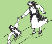
Savali i luga o le vai