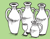
Suia le vai i le uaina