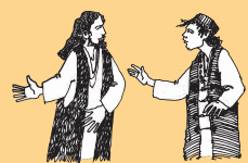
Valaaulia le taitai mauoa talavou