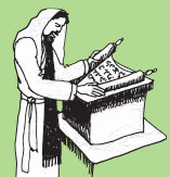
Teena i Nasareta