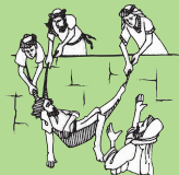
Aoao atu ma faamalolo i Kalilaia atoa