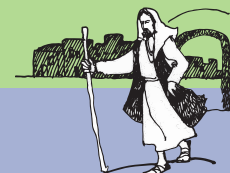
Le Taliaina e le au Samaria