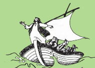
Faafilemu le sami