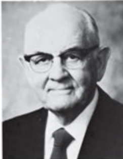
Spencer W. Kimball

(George Q. Cannon ordenó apóstol a Heber J. Grant el 16 de octubre de 1882).