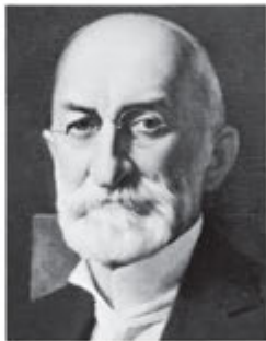
Heber J. Grant

(Brigham Young ordenó apóstol a George Q. Cannon el 26 de agosto de 1860).