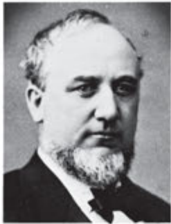
George Q. Cannon

(Ordenado apóstol por los tres testigos que actuaban bajo la autoridad de José Smith, 14 de febrero de 1835).