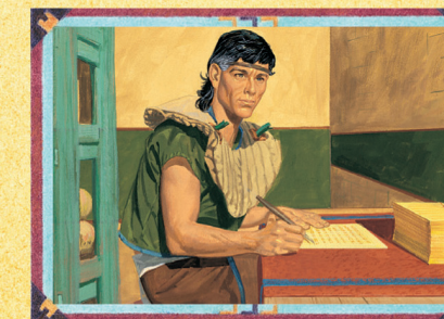
MÓRMON (CAPÍTULO 49)