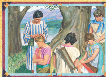
ALMA (CAPÍTULO 15)