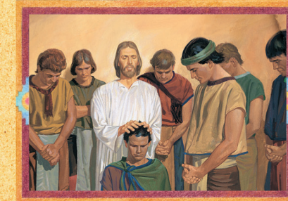
JESUS CRISTO (CAPÍTULO 43)