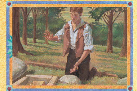
JOSEPH SMITH (CAPÍTULO 1)