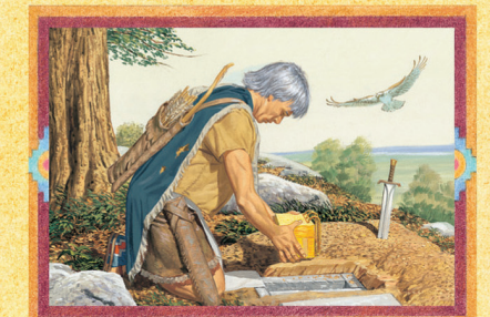
MORÔNI (CAPÍTULO 54)