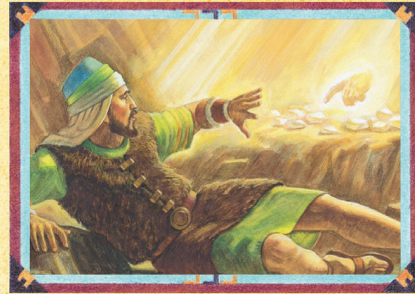
O IRMÃO DE JAREDE (CAPÍTULO 51)