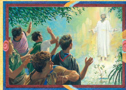
ALMA, O FILHO (CAPÍTULO 18)