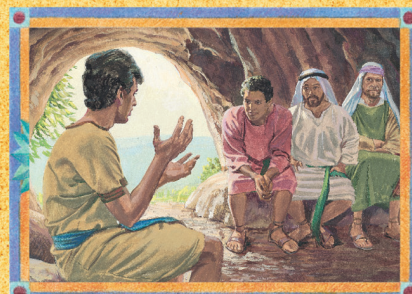
NÉFI, SAM, LAMÁ, LEMUEL (CAPÍTULO 4)