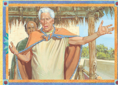
REI BENJAMIM (CAPÍTULO 12)