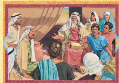
LEÍ (CAPÍTULO 6)