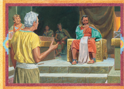
ABINÁDI E O REI NOÉ (CAPÍTULO 14)