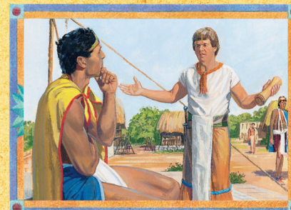
AMON E O REI LAMÔNI (CAPÍTULO 23)