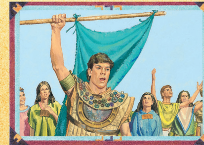
CAPITÃO MORÔNI (CAPÍTULO 32)