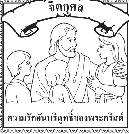
ความรักอันบริสุทธิ์ของพระคริสต์