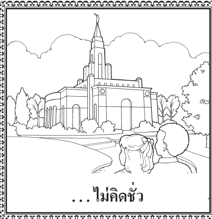
... ไม่คิดชั่ว