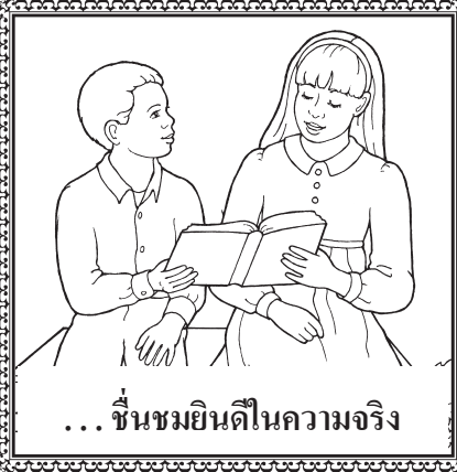
... ขึ้นชมยินดีในความจริง