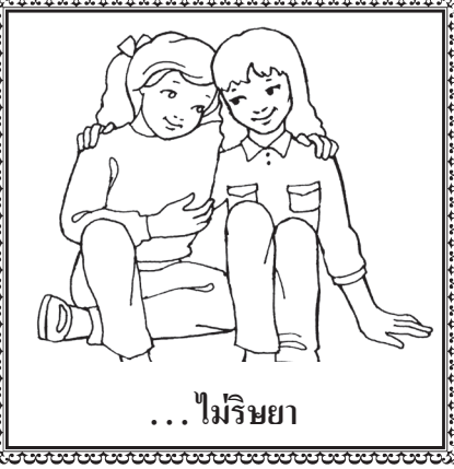
... ไม่ริษยา