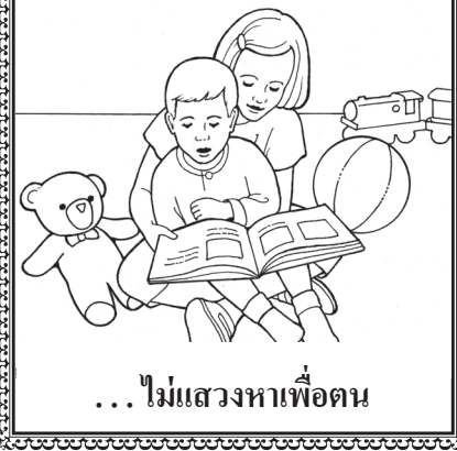
... ไม่แสวงหาเพื่อตน

ระบายสีรูปภาพ และใช้กรรไกร ตัดรูปทรงออกตามเส้นทึบ พับ ตามรอยประทุกเส้น และทากาว หรือใช้กระดาษกาวติดแถบทำ เป็นลูกเต๋า ทอดลูกเต๋าแล้วเล่าว่า ท่านสามารถแสดงจิตกุศลตามวิธี ที่อยู่ด้านบนสุดของลูกเต๋านั้นได้ อย่างไร ถ้าคำว่า จิตกุศล อยู่ด้าน บนสุด ให้แบ่งปันวิธีที่พระเจ้าช่วย ให้รอดทรงแสดงความรักของ พระองค์