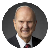
Presidente Russell M. Nelson