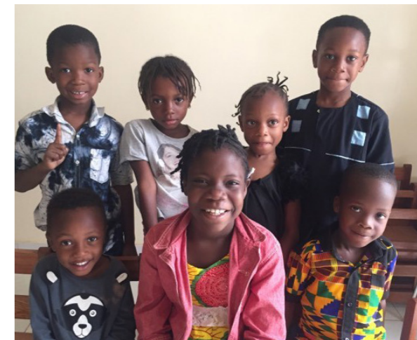
Nossa Primária de Dacar, Senegal , manda um oi!