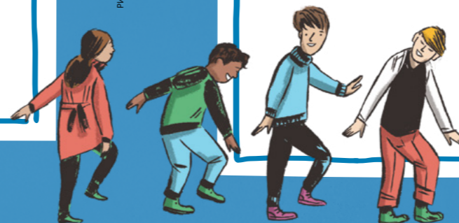
РИСУНКИ ЭТИ ДОКРИЛЛ

А теперь сыграйте в игру! Выберите одного человека на роль руководителя. Руководитель дает каждому игроку задание, например, пройти по комнате, хлопнув три раза. Потренируйтесь делать то, о чем просит руководитель, а не то, что делают люди вокруг вас!