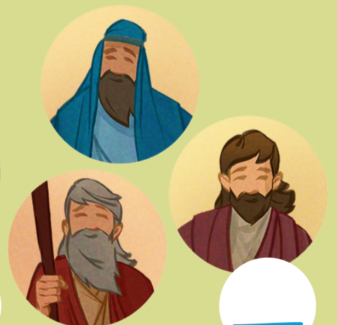
8. Moisés, Elias e Elias, o Profeta (Doutrina e Convênios 110:11-16)