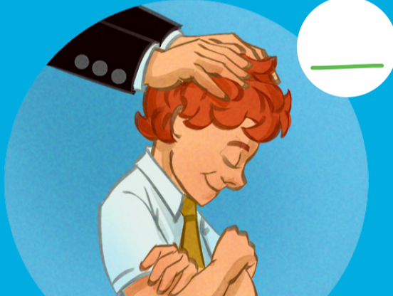
4. Poder do sacerdócio