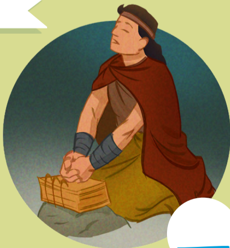
6. Morôni (Doutrina e Convênios 128:20; Joseph Smith—História 1:30-34)