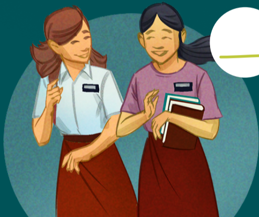
3. Obra missionária