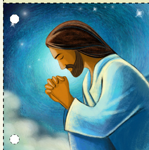
5. Jézus elment a Gecsemáné kertjébe, hogy Mennyei Atyához imádkozzon. Ott elkezdett szenvedni a bűneinkért. Emberek jöttek karddal a kezükben, és elfogták Őt. (Lásd Máté 26:36–50.)