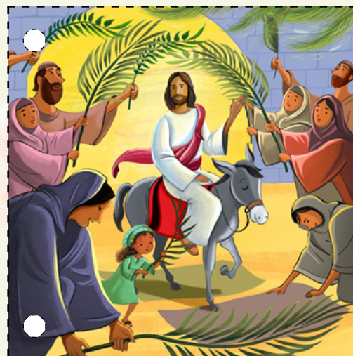
1. Jézus Krisztus szamárháton ment be Jeruzsálem városába. Az emberek dicsőítették Őt, és pálmaágakat fektettek le a földre. (Lásd Márk 11:1–11.)

● Lásd a Jöjj, kövess engem! -ben a Tan és szövetségek 29-hez és a húsvéhoz kapcsolódó részt.