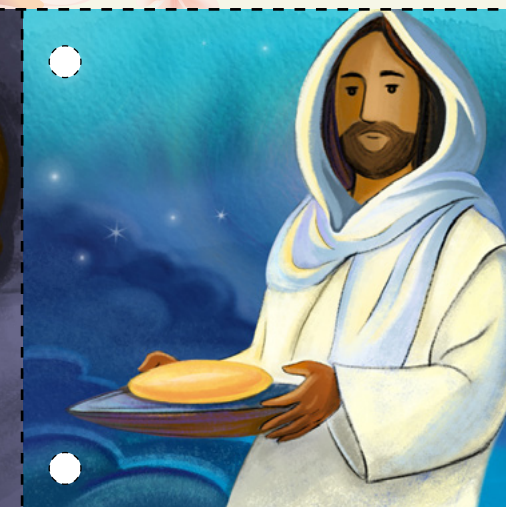
4. Jézus elfogyasztotta a pészahi vacsorát a tanítványaival. Azért adta nekik az úrvacsorát, hogy segítsen emlékezniük Órá. (Lásd Máté 26:19–20, 26–28.)