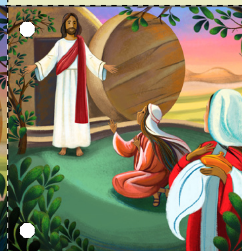
7. Az angyalok elgörgették a követ. Megmondták Mária Magdalénának és a többi asszonynak, hogy Jézus feltámadt. Jézus megjelent a nőknek, akik aztán hódoltak Neki. (Lásd Máté 28:1–10.)