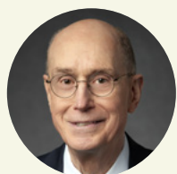
Írta: Henry B. Eyring elnök második tanácsos az Első Elnökségben