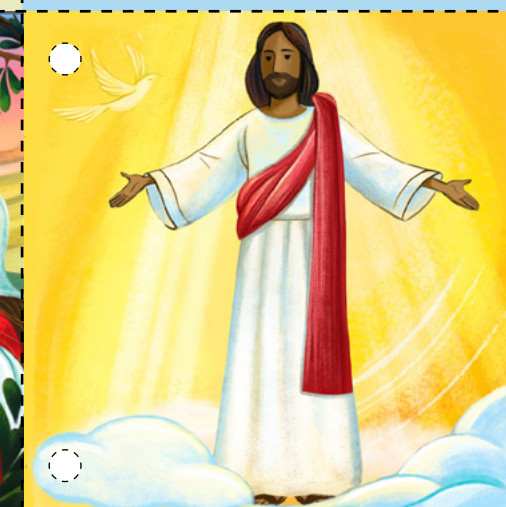
8. Jézus megjelent a tanítványainak. A tanítványok megérintették a feltámadt testét. Azt mondta nekik, hogy tanítsák mindenkinek az Ő evangéliumát. Jézus Krisztus feltámadt, ezért mi is fel fogunk támadni! (Lásd Lukács 24:36–43; Máté 28:16–20.)