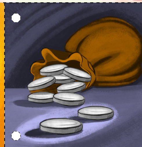
3. Az irigy papok 30 ezüstpénzt fizettek Jézus Krisztus egyik tanítványának, Iskariotes Júdásnak azért, hogy átadja nekik Jézust. (Lásd Máté 26:14–16.)