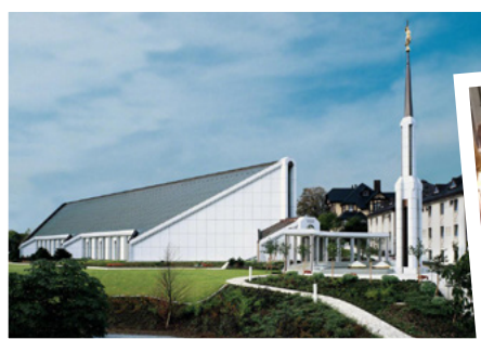
A templom egy ideig zárva tartott, hogy fel lehessen újítani. Ezt követően újra fel kellett szentelni.

Az apostolok szerte a világon szolgálattételt nyújtanak az embereknek, és Jézus Krisztusról tanítják őket.