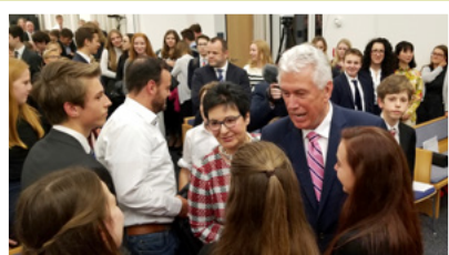
Uchtdorf elder és Uchtdorf nővér a fiatalokkal is találkozott. „Amikor eljöttök a templomba, mindig gondolatok Jézus Krisztusra és hogy mit jelent Ő a számotokra!” – tanácsolta Uchtdorf elder.

„Az Úr házának felszentelése az öröm ideje. A hálaadás ideje.”*