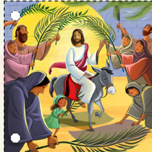
1. Հիսուս Քրիստոսը մտավ Երուսաղեմ ավանակի վրա նստած: Մարդիկ գովաբանում էին Երուսաղեմը և արմավենու ճյուղեր էին փռում գետնին: (Տես Մարկոս 11.1-11)

● Տես Եկ, հետևիր Ինձ. Վարդապետություն և Ուխտեր 29 և Զատիկի համար