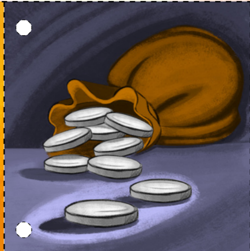
3. Չար քահանաները Հիսուս Քրիստոսի աշակերտներից մեկին՝ Հուդա Իսկարիոտ-տաճուն, վճարեցին 30 արծաթ, որպեսզի Հիսուսին հանձնի իրենց: (Տես Մատթեոս 26.14-16)