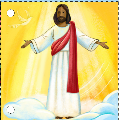
8. Հիսուսը հայտնվեց Իր աշակերտներին: Երանք շոշափեցին Երուսաղեմը հարություն առած մարմնիկը: Նա պատվիրեց կրանց, որ բոլորին ուսուցանեն Իր ավետարանը: Հիսուս Քրիստոսը կրկին հարություն առավ, մենք կույանա հարություն կառնենք: (Տես Դուկաս 24.36-43, Մատթեոս 28.16-20)