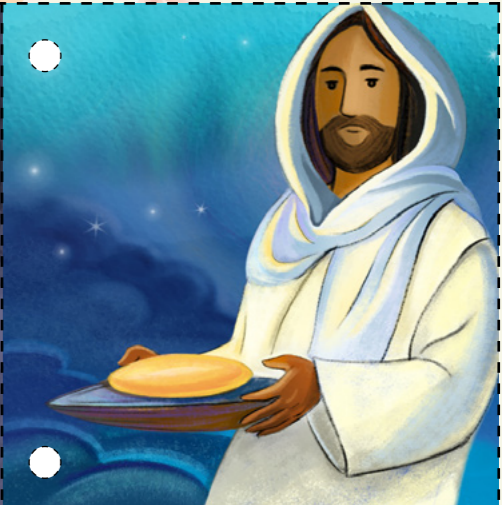
4. Հիսուսը Իր աշակերտների հետ կերավ Զատիկի ուտելիքը: Հիսուսը տվեց կրանց հաղորդությունը, որպեսզի օգնի հիշել Իրեն: (Տես Մատթեոս 26.19, 26-28)