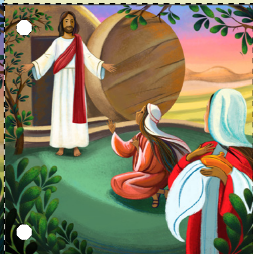
7. Հրեշտակները գործեցին և հեռացրին քարը: Երանք ասացին Մարիամ Մագդաղենացուն և մյուս կանանց, որ Հիսուսը հարություն է առել: Հիսուսը հայտնվեց կանանց, և կրանք երկրպագեցին Երուսաղեմը: (Տես Մատթեոս 28.1-10)