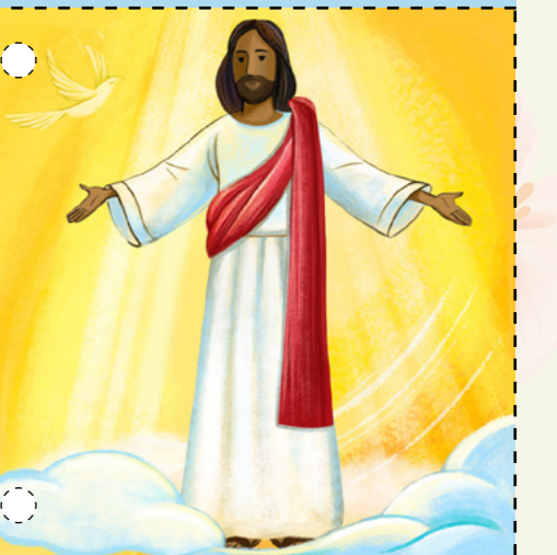
៨. ព្រះយេស៊ូវគ្រីស្ទបានបង្ហាញព្រះកាយដល់ពួកសិស្សរបស់ទ្រង់ ។ ពួកគេបានបិទព្រះកាយដែលបានរស់ឡើងវិញរបស់ទ្រង់ ។ ទ្រង់ បានប្រាប់ពួកគេឲ្យបង្រៀនមនុស្សគ្រប់គ្នាអំពីដំណឹងល្អរបស់ទ្រង់ ។ ព្រះយេស៊ូវគ្រីស្ទបានមានព្រះជន្មរស់ឡើងវិញ ដូច្នេះយើងនឹងរស់ ឡើងវិញផងដែរ ! ( សូមមើល លូកា ២៤:៣៦-៤៣; ម៉ាថាយ ២៨: ១៦-២០ ) ។