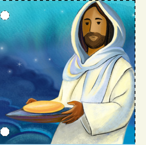
៤. ព្រះយេស៊ូវបានសោយអាហារបុណ្យរៀលជាមួយពួកសិស្សទ្រង់ ។ ទ្រង់បានប្រទានសាត្រាម៉ង់ដល់ពួកគេ ដើម្បីជួយពួកគេឲ្យចងចាំដល់ ទ្រង់ ។ ( សូមមើល ម៉ាថាយ ២៦:១៩-២០, ២៦-២៨ ) ។