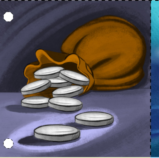
៣. ពួកសង្ឃដែលប្រណែនបានបង់ថ្លៃដល់សិស្សម្នាក់របស់ ព្រះយេស៊ូវគ្រីស្ទ ឈ្មោះ យូដាស-អ៊ីស្ការីយ៉ុត ចំនួន ៣០ រៀល ដើម្បីបញ្ជូនទ្រង់ឲ្យពួកគេ ។ ( សូមមើល ម៉ាថាយ ២៦:១៤-១៦ ) ។