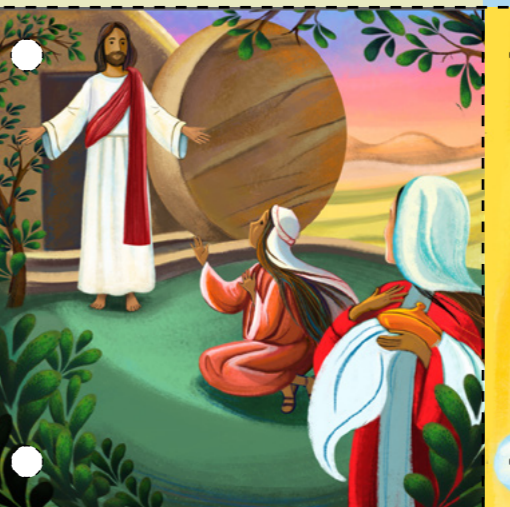
៧. ពួកទេវតាបានរមៀលថ្មនោះចេញ ។ ពួកទេវតាបានប្រាប់ ម៉ាក ម៉ាក់ជាឡា និងស្ត្រីរៀនទៀតថា ព្រះយេស៊ូវបានមានព្រះជន្មរស់ឡើង វិញហើយ ។ ព្រះយេស៊ូវបានបង្ហាញព្រះកាយដល់ពួកស្ត្រីនោះ ហើយ ពួកគេបានថ្វាយបង្គំទ្រង់ ។ ( សូមមើល ម៉ាថាយ ២៨:១-១០ ) ។