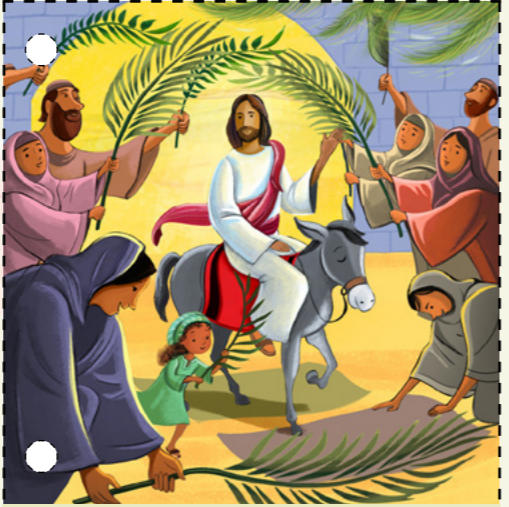
១. ព្រះយេស៊ូវគ្រីស្ទបានគង់លើសត្វលាមួយចូលទៅក្នុងទីក្រុង យេរូសាឡឹម ។ ប្រជាជនបានសរសើរតម្កើងទ្រង់ ហើយបានដាក់ស្លឹក ត្នោតនៅលើដី ។ ( សូមមើល ម៉ាថាយ ១១:១-១១ ) ។