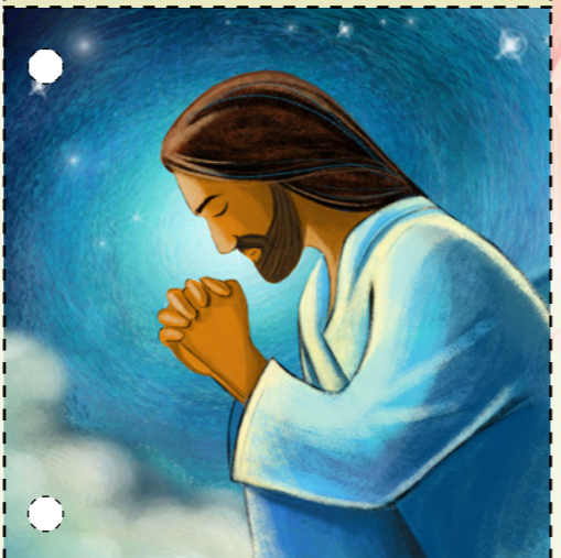
៥. ព្រះយេស៊ូវបានយាងទៅច្បារតែតសេម៉ានី ដើម្បីអធិស្ឋានទៅ កាន់ព្រះវរបិតាស្ងួត ។ នៅទីនោះ ទ្រង់បានងទុក្ខជំនួសអំពើបាប របស់យើង ។ មនុស្សបានមកទំនោះជាមួយនឹងដាវ ហើយបានចាប់ ទ្រង់ ។ ( សូមមើល ម៉ាថាយ ២៦:៣៦-៥០ ) ។