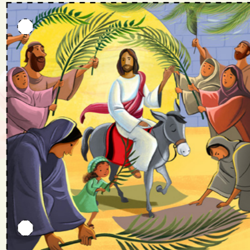
1. Chúa Giê Su Kỵ Tô cưỡi lừa vào thành Giê Ru Sa Lem. Mọi người ca tụng Ngài và rải lá cọ xuống đất để đón Ngài. (Xin xem Mác 11:1-11.)

Phỏng theo bài "Ngài Đã Sống Lại!" Liahona, tháng Tư năm 2013, trang 4-5.