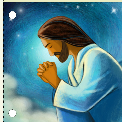
5. Chúa Giê Su đi đến Ghết Sê Ma Nê để cầu nguyện lên Cha Thiên Thượng. Tại đó Ngài bắt đầu chịu đau đớn bởi tội lỗi của chúng ta. Người ta mang gươm đến và bắt giữ Ngài. (Xin xem Ma Thi Ơ 26:36-50.)