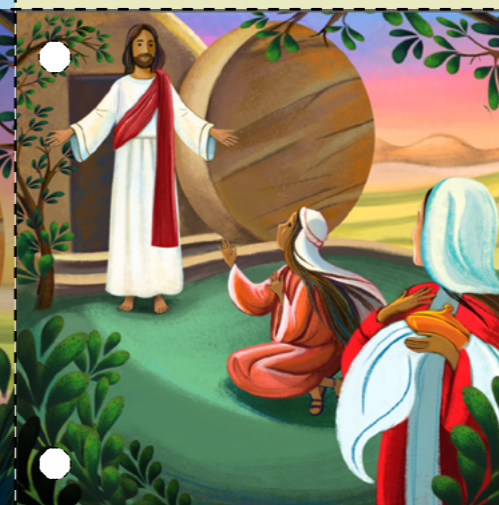
7. Các thiên sứ đến lăn tảng đá đi. Họ nói với Mary Magdelene và những người phụ nữ khác rằng Chúa Giê Su đã phục sinh. Chúa Giê Su hiện đến cùng những người phụ nữ, và họ thờ phượng Ngài. (Xin xem Ma Thi Ơ 28:1-10.)