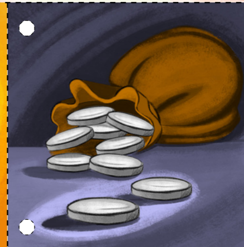
3. Những thầy tế lễ ghen tị đã trả cho Giu Đa Ích Ca Ri Ôt, một trong các môn đồ của Chúa Giê Su Kỵ Tô, 30 đồng bạc để đem nộp Ngài cho chúng. (Xin xem Ma Thi Ơ 26:14-16.)