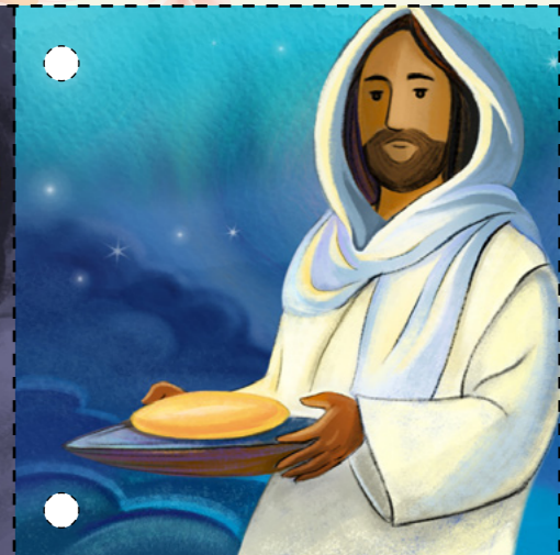
4. Chúa Giê Su dùng bữa tối lễ Vượt Qua với các môn đồ của Ngài. Ngài ban cho họ Tiệc Thánh để giúp họ nhớ đến Ngài. (Xin xem Ma Thi Ơ 26:19-20, 26-28.)