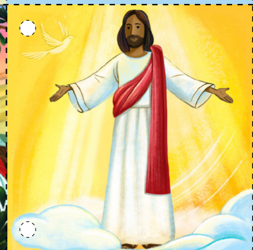
8. Chúa Giê Su hiện đến cùng các môn đồ Ngài. Họ chạm vào thể xác đã được phục sinh của Ngài. Ngài phán bảo họ phải dạy dỗ mọi người phúc âm của Ngài. Chúa Giê Su Kỵ Tô đã sống lại lần nữa, vì thế chúng ta cũng sẽ sống lại! (Xin xem Lu Ca 24:36-43; Ma Thi Ơ 28:16-20.)

HÌNH ẢNH MINH HỌA DO STELYANA DONEVA THỰC HIỆN